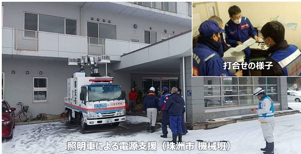
照明車による電源支援 (珠州市 機械班)