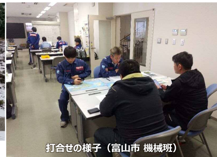
打合せの様子 (富山市 機械班)