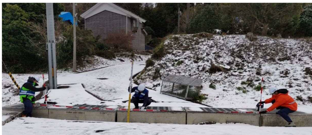
被災状況調査 (輪島市 道路班)