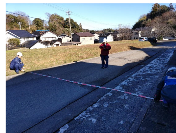
被災状況調査（能登町 道路班）