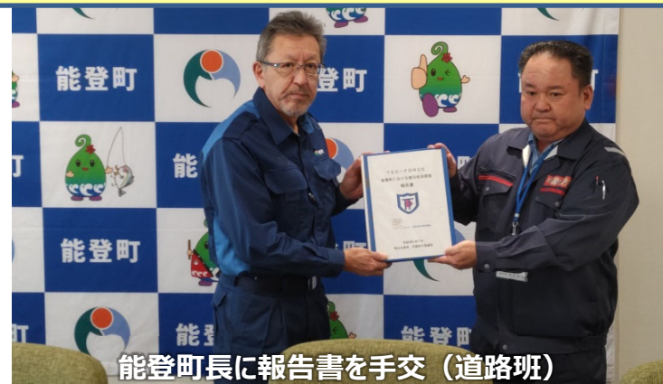
能登町長に報告書を手交（道路班）