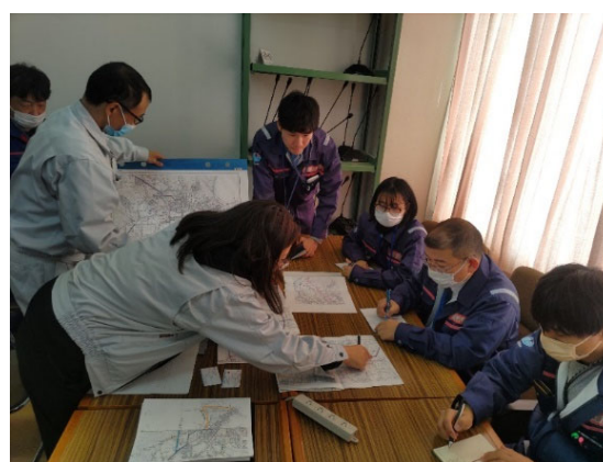
被災自治体職員との 打合せの様子（輪島市 道路班）