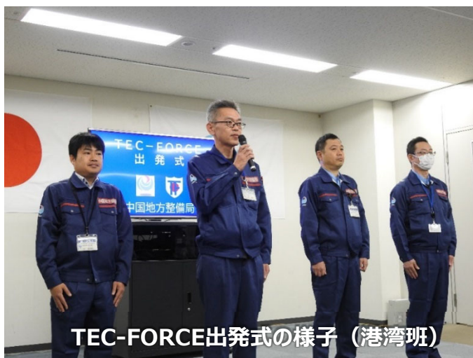
TEC-FORCE出発式の様子（港湾班）