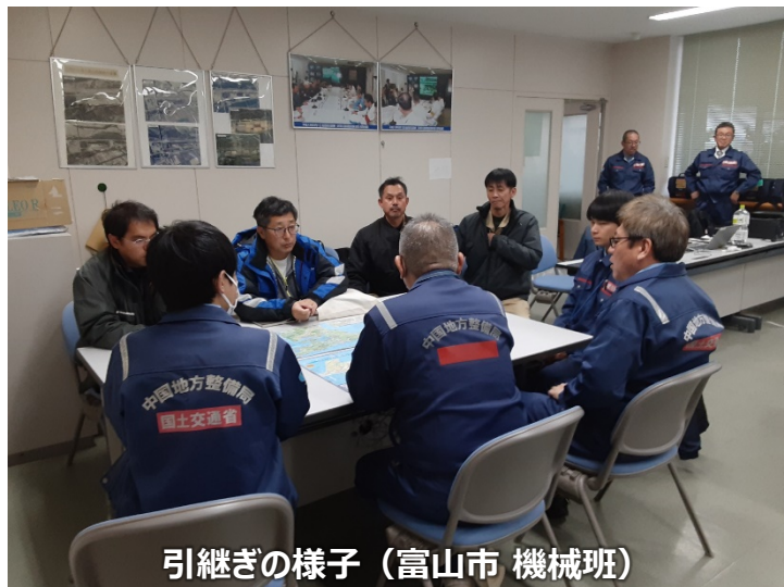
引継ぎの様子（富山市 機械班）