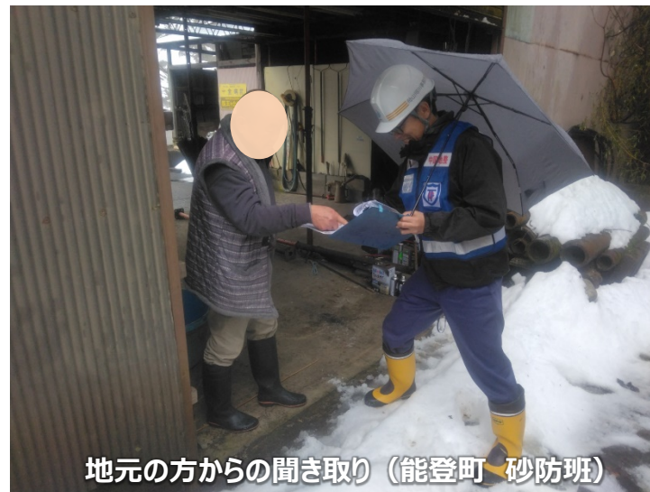
地元の方からの聞き取り（能登町 砂防班）