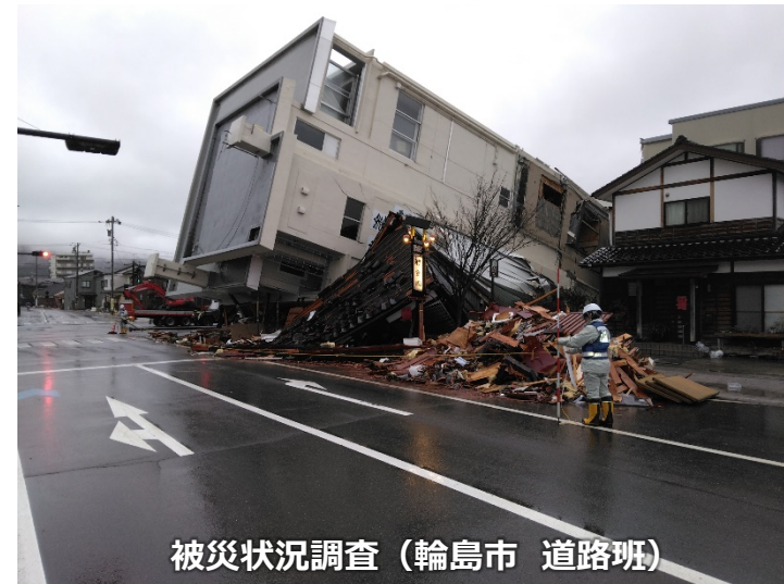
被災状況調査（輪島市 道路班）