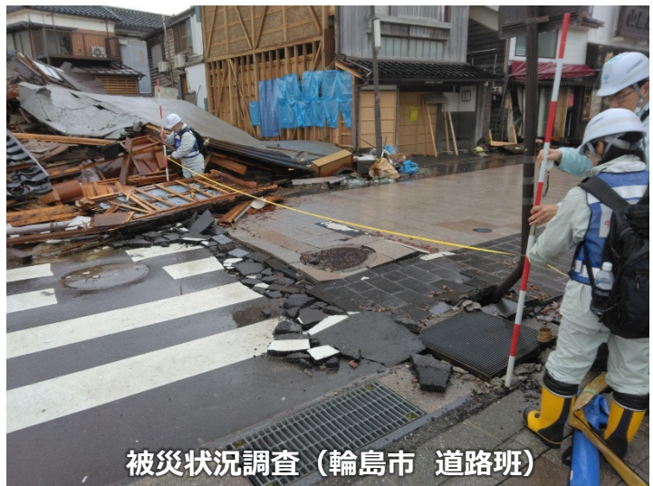
被災状況調査（輪島市 道路班）