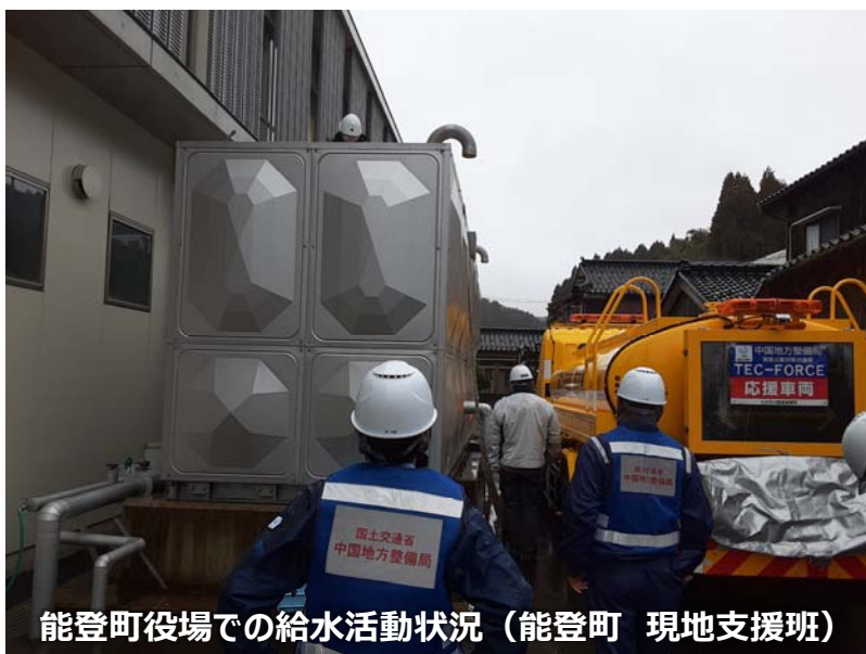
能登町役場での給水活動状況（能登町 現地支援班）