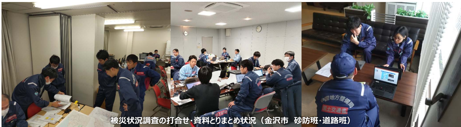
被災状況調査の打合せ・資料とりまとめ状況（金沢市 砂防班・道路班）

「TEC-FORCE派遣状況」 1月21日（日）12班・45名 のべ703人・日（1/4～1/21）