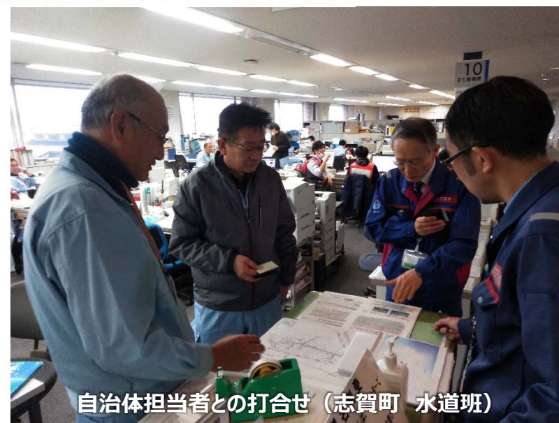
自治体担当者との打合せ（志賀町 水道班）