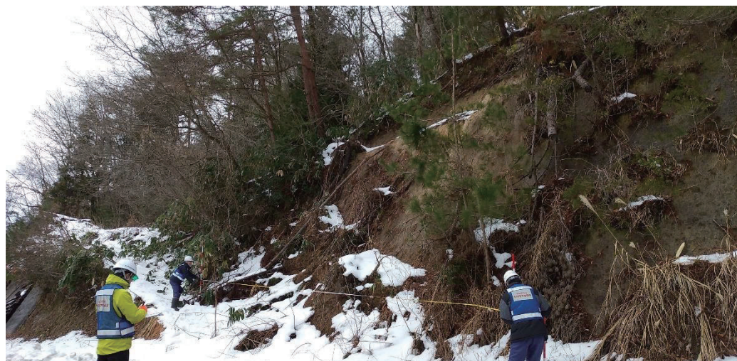
被災状況調査（能登町字出津山分 砂防班）