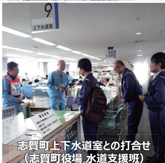
志賀町上下水道室との打合せ （志賀町役場 水道支援班）