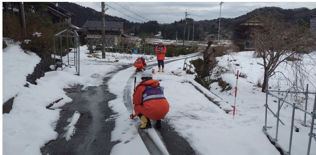
被災状況調査（輪島市西脇町 道路班）