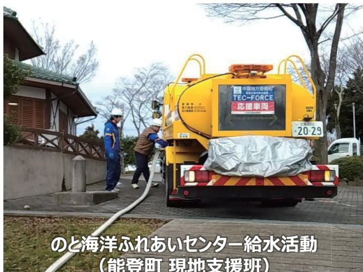
のと海洋ふれあいセンター給水活動 （能登町 現地支援班）