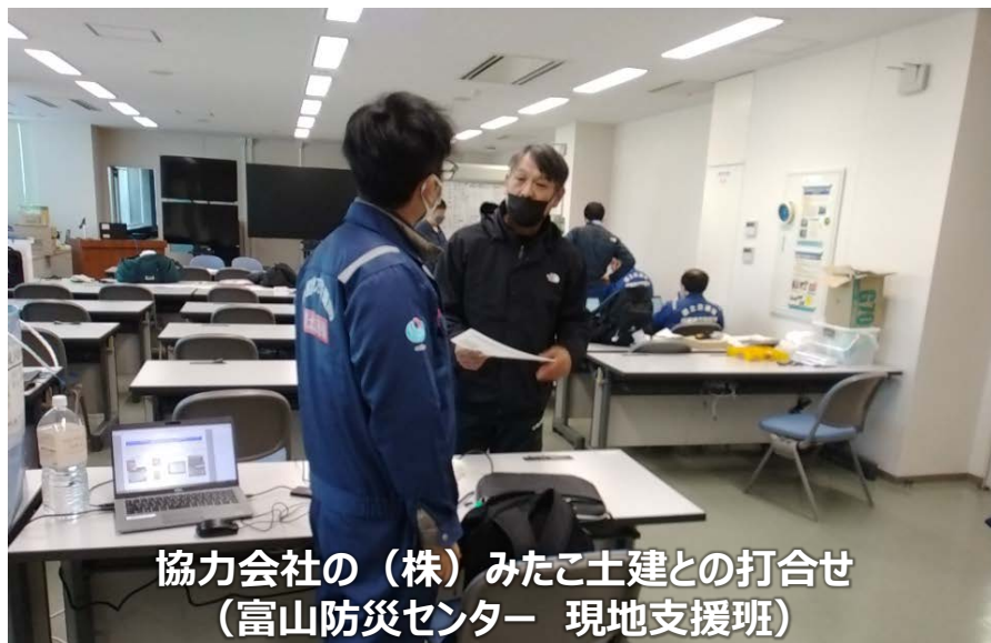
協力会社の（株）みたこ土建との打合せ （富山防災センター 現地支援班）

「TEC-FORCE派遣状況」 1月30日（火）13班・46名 のべ1,117人・日（1/4～1/30）