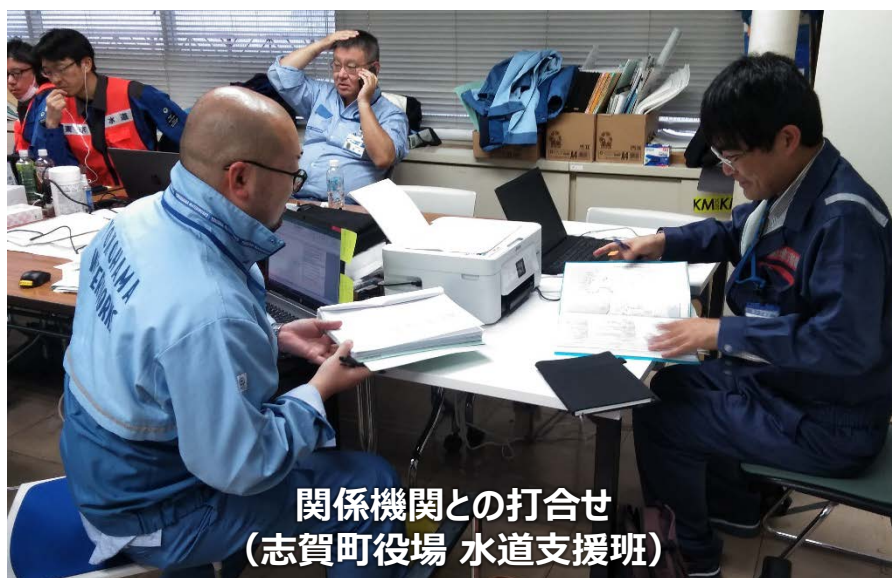
関係機関との打合せ （志賀町役場 水道支援班）