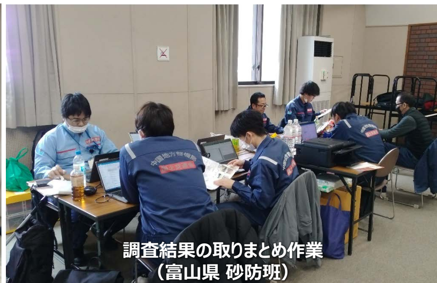
調査結果の取りまとめ作業 （富山県 砂防班）