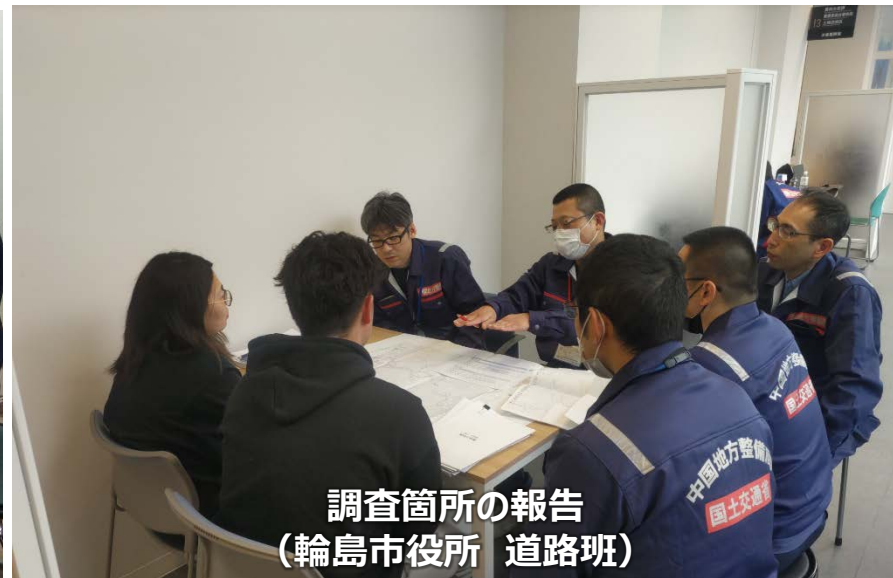
調査箇所の報告 （輪島市役所 道路班）