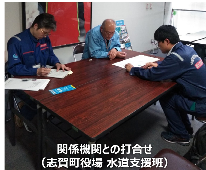
関係機関との打合せ （志賀町役場 水道支援班）