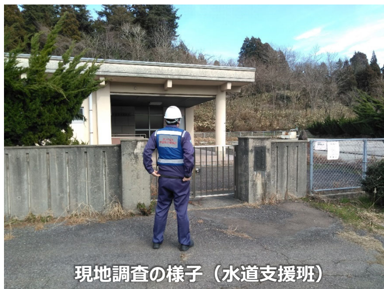
現地調査の様子（水道支援班）