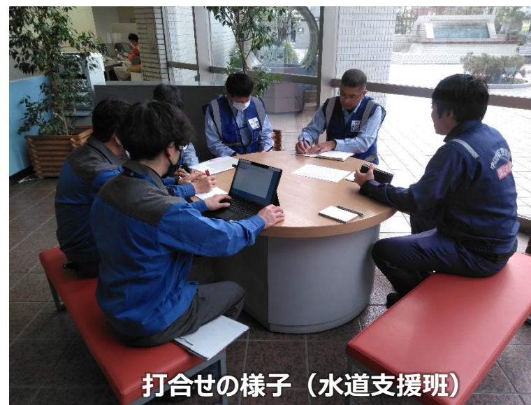
打合せの様子（水道支援班）