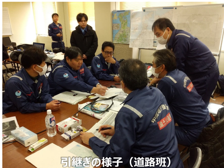
引継ぎの様子（道路班）