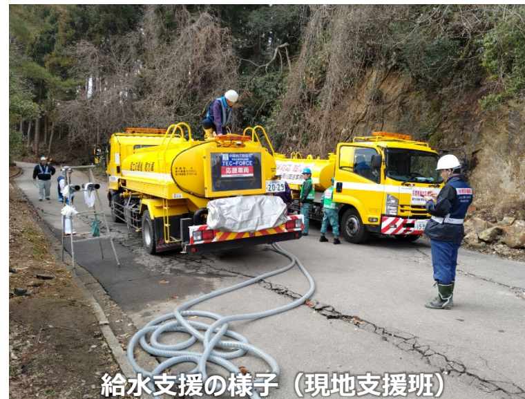
給水支援の様子（現地支援班）