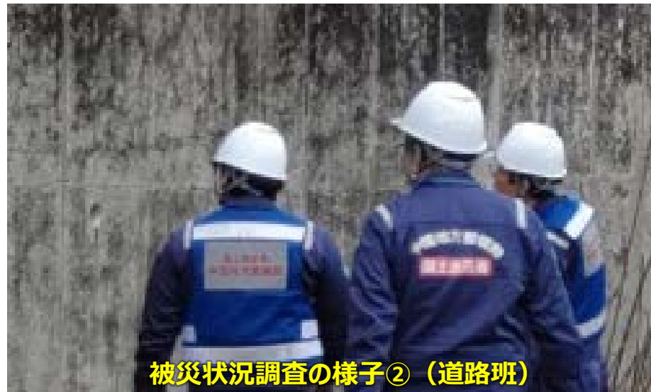
被災状況調査の様子②（道路班）