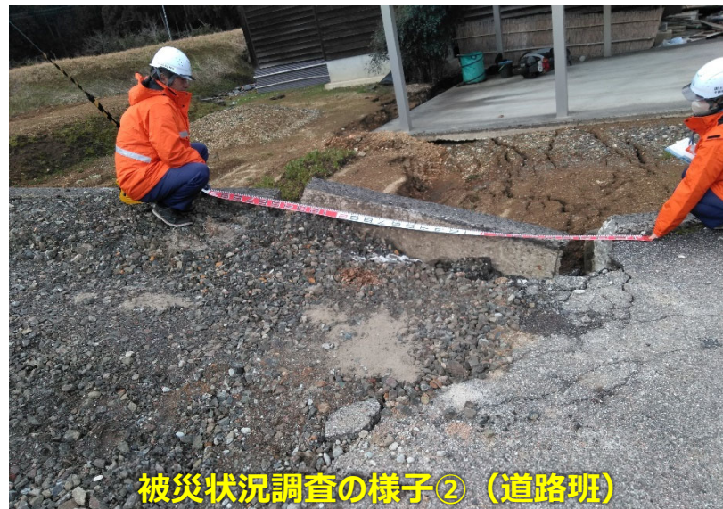
被災状況調査の様子②（道路班）