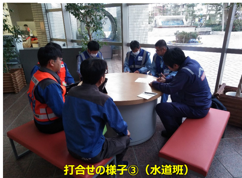
打合せの様子③（水道班）