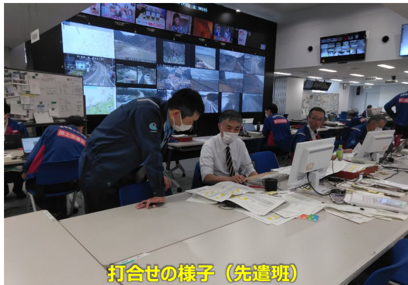
打合せの様子（先遣班）

◀TEC-FORCE派遣状況▶ 2月16日（金）7班・20名 のべ1,553人・日（1/4～2/16）