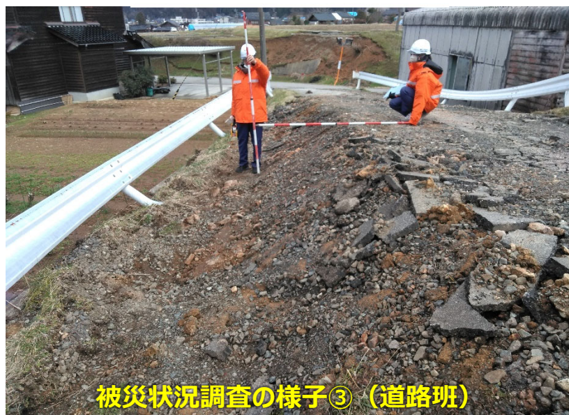
被災状況調査の様子③（道路班）