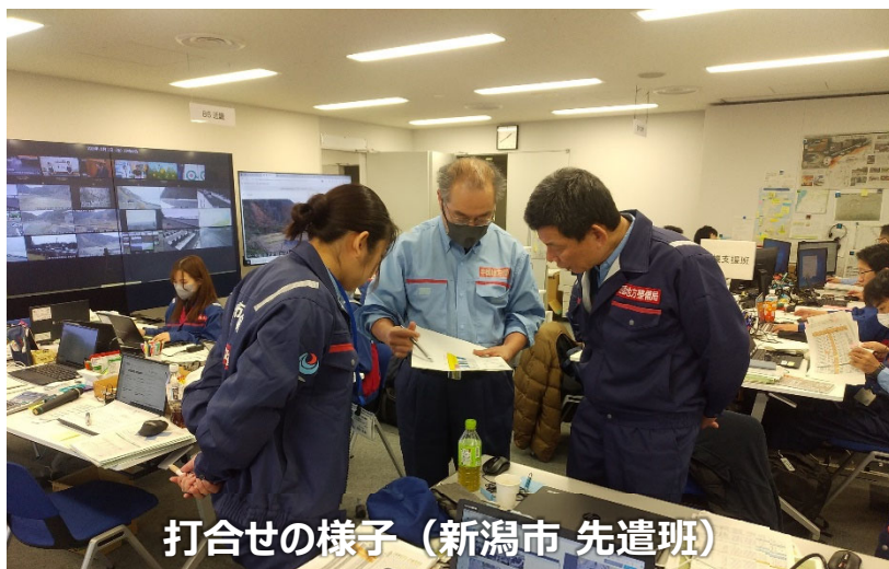
打合せの様子（新潟市 先遣班）

「TEC-FORCE派遣状況」 2月2日（金）10班・31名 のべ1,225・日（1/4～2/2）