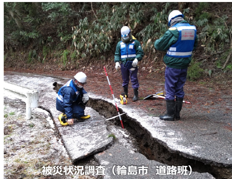
被災状況調査（輪島市 道路班）