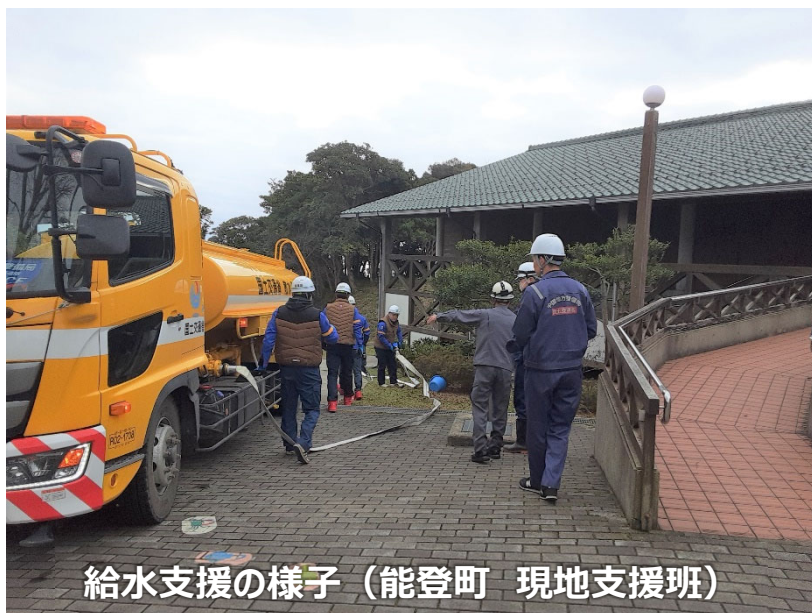
給水支援の様子（能登町 現地支援班）