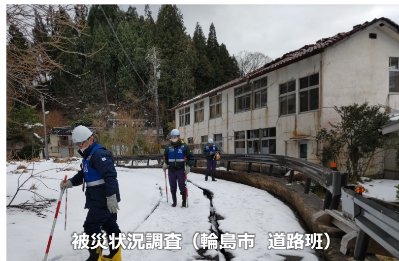
被災状況調査（輪島市 道路班）