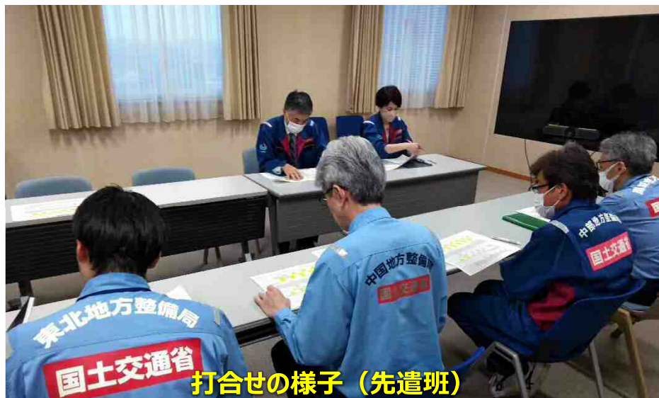
打合せの様子（先遣班）