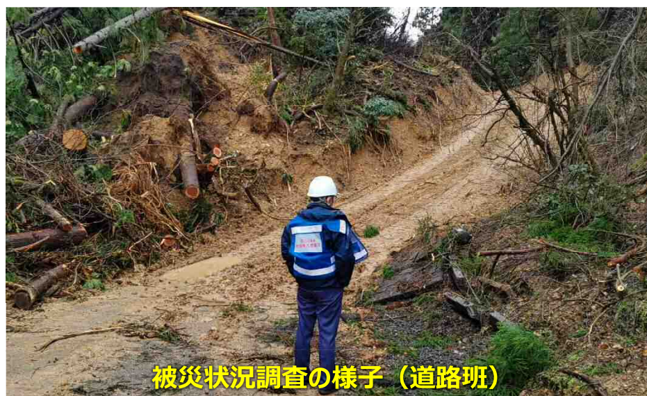
被災状況調査の様子（道路班）