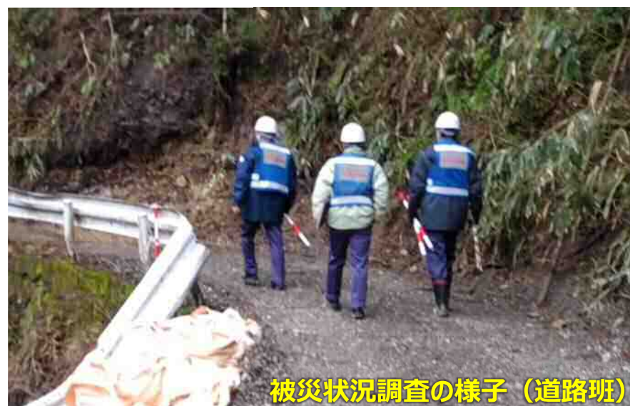
被災状況調査の様子（道路班）