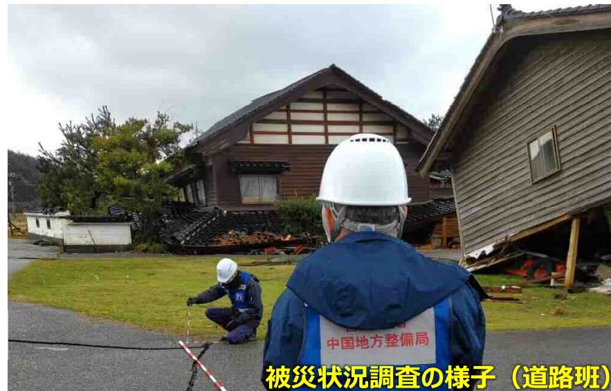
被災状況調査の様子（道路班）