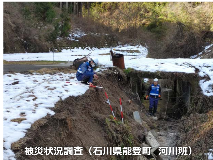
被災状況調査 (石川県能登町 河川班)