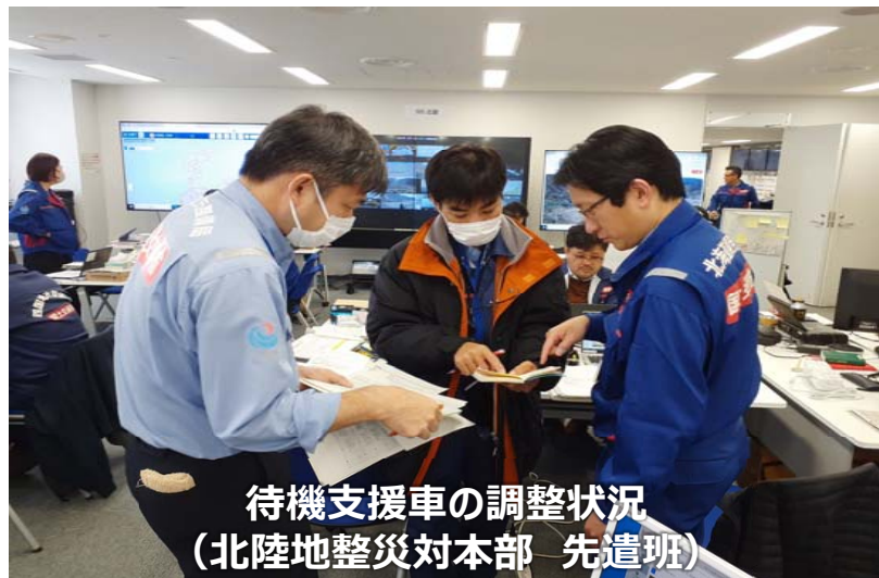
待機支援車の調整状況 (北陸地整災対本部 先遣班)