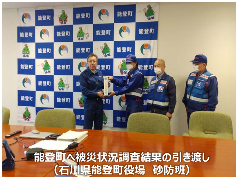
能登町へ被災状況調査結果の引き渡し (石川県能登町役場 砂防班)