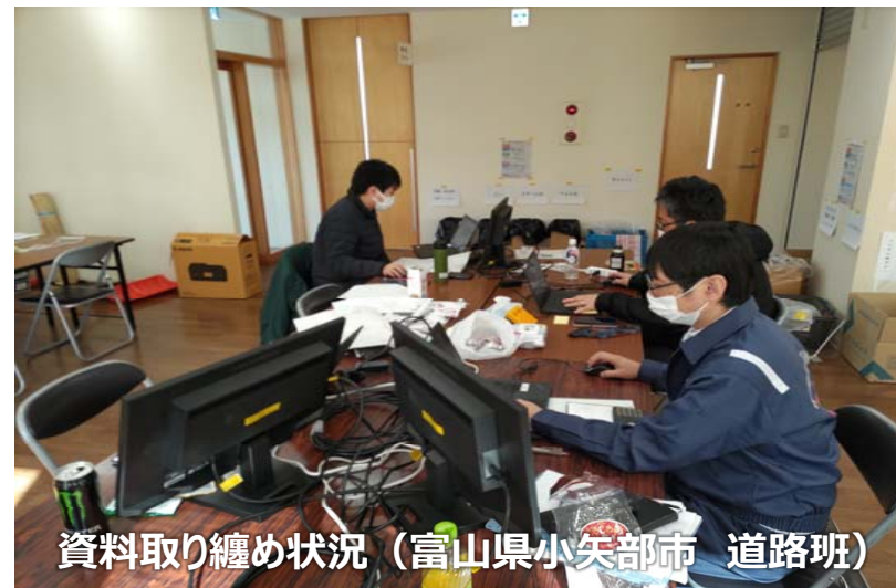
資料取り纏め状況 (富山県小矢部市 道路班)