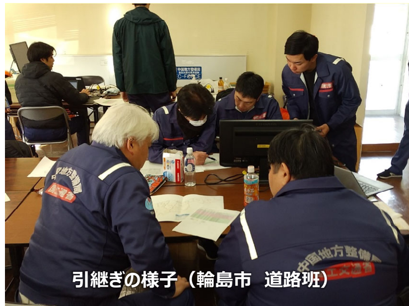
引継ぎの様子（輪島市 道路班）