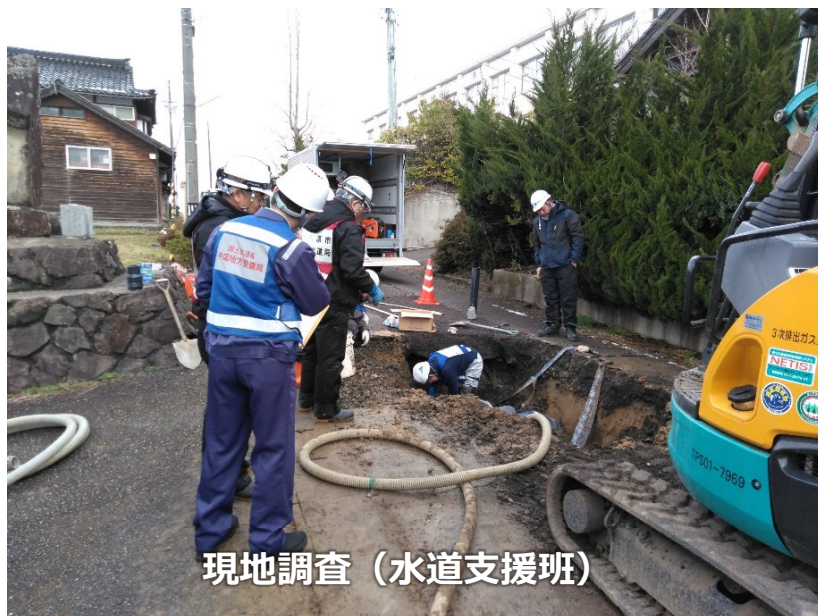
現地調査（水道支援班）

《TEC-FORCE派遣状況》 2月7日（水）9班・29名 のべ1,373人・日（1/4～2/7）