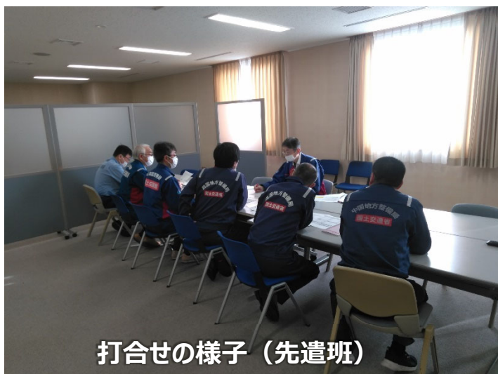
打合せの様子（先遣班）