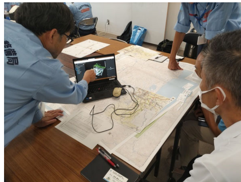
鳥取市への説明（河川班①）