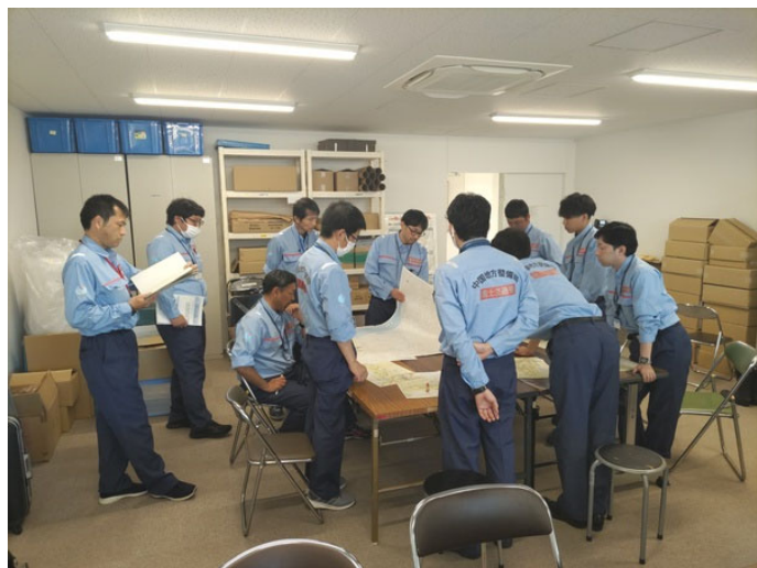
調査範囲作戦会議（鳥取市役所にて）