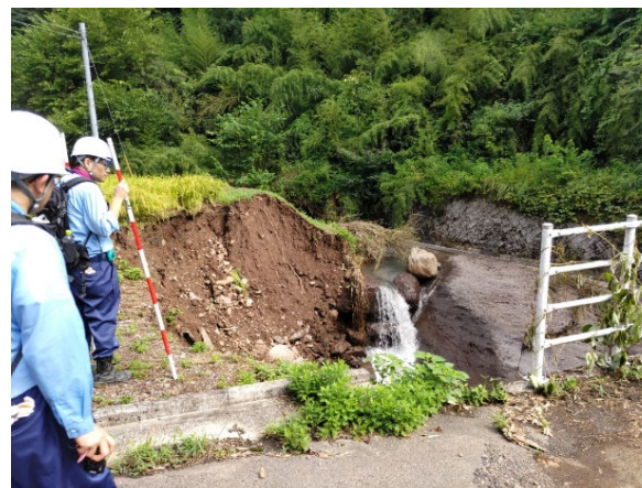
被災箇所の点群データ取得、 崩落部分の3D化