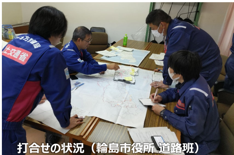
打合せの状況 (輪島市役所 道路班)