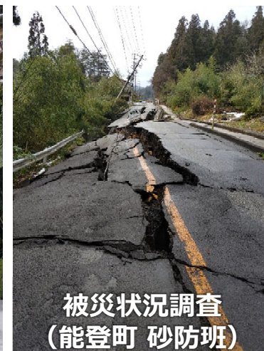
被災状況調査 (能登町 砂防班)