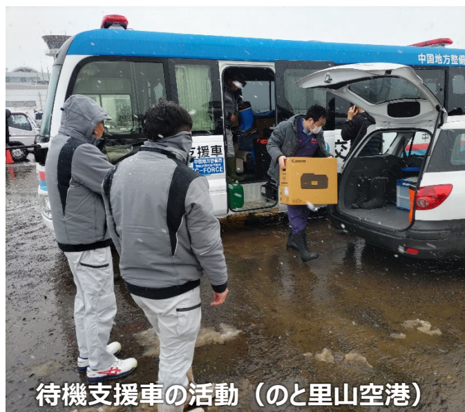
待機支援車の活動 (のと里山空港)