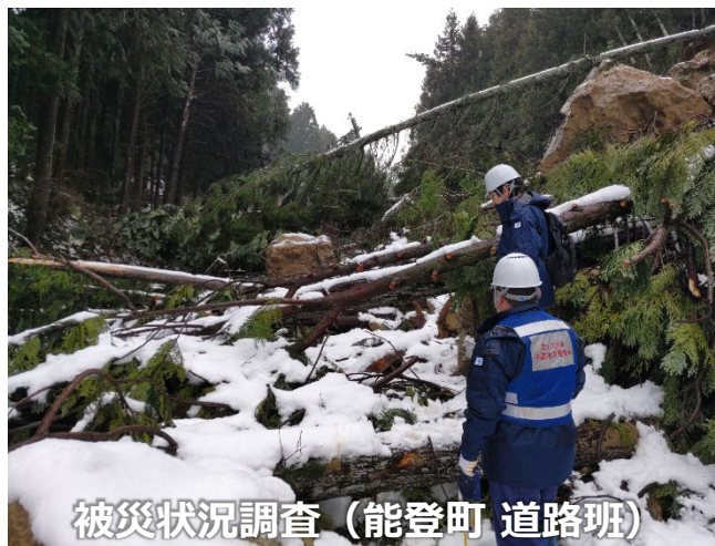
被災状況調査 (能登町 道路班)