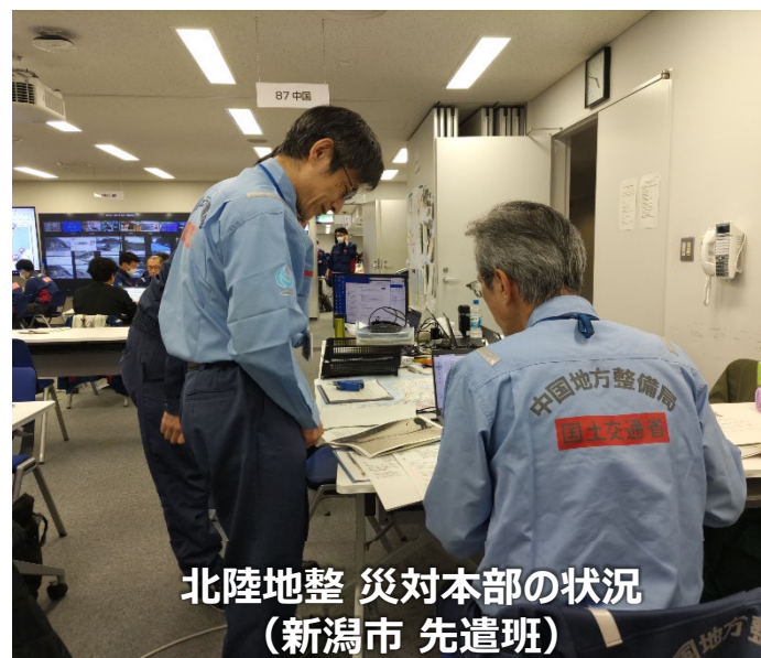
北陸地整 災対本部の状況 (新潟市 先遣班)