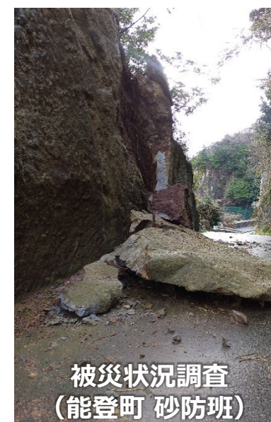
被災状況調査 (能登町 砂防班)