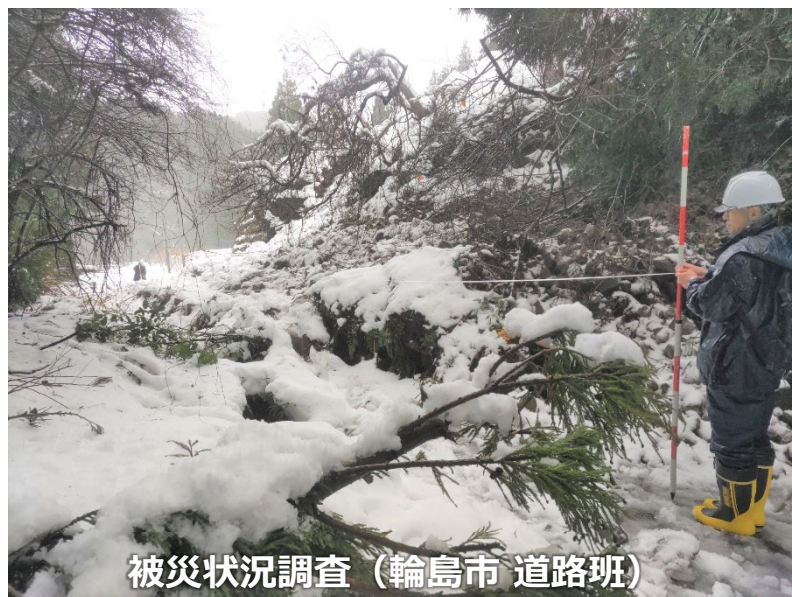
被災状況調査（輪島市 道路班）