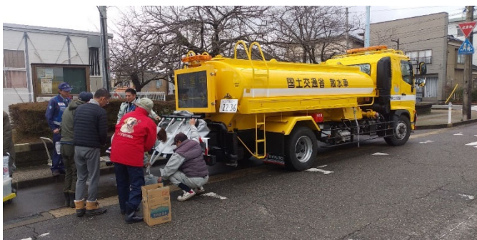
給水活動（能登町 崎山山村開発センター）

派遣期間：1月4日～ 派遣先：石川県志賀町、能登町 派遣人数：のべ12人・日 活動内容：志賀町、能登町の給水支援