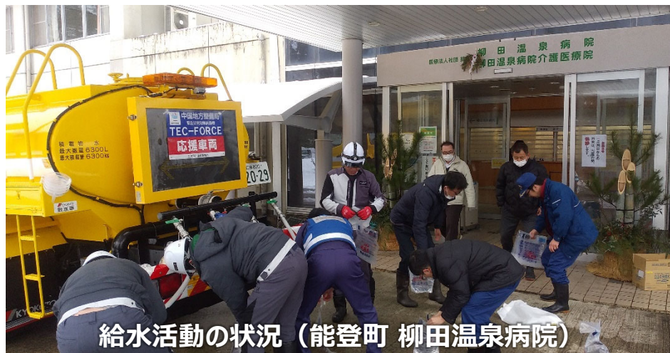
給水活動の状況（能登町 柳田温泉病院）