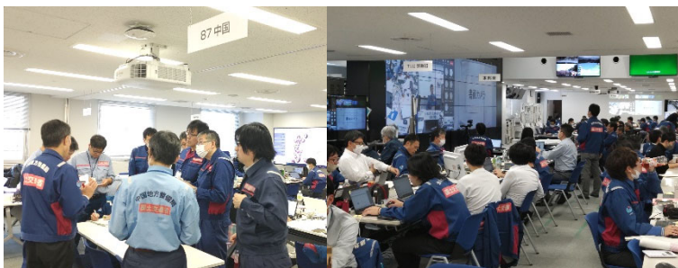
北陸地整 災害対策本部での活動状況

派遣期間：1月5日～ 派遣先：北陸地整 災害対策本部 派遣人数：のべ20人・日 活動内容：災害対策本部との調整・報告