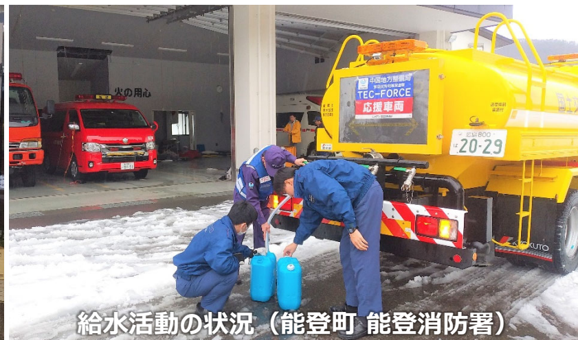
給水活動の状況（能登町 能登消防署）