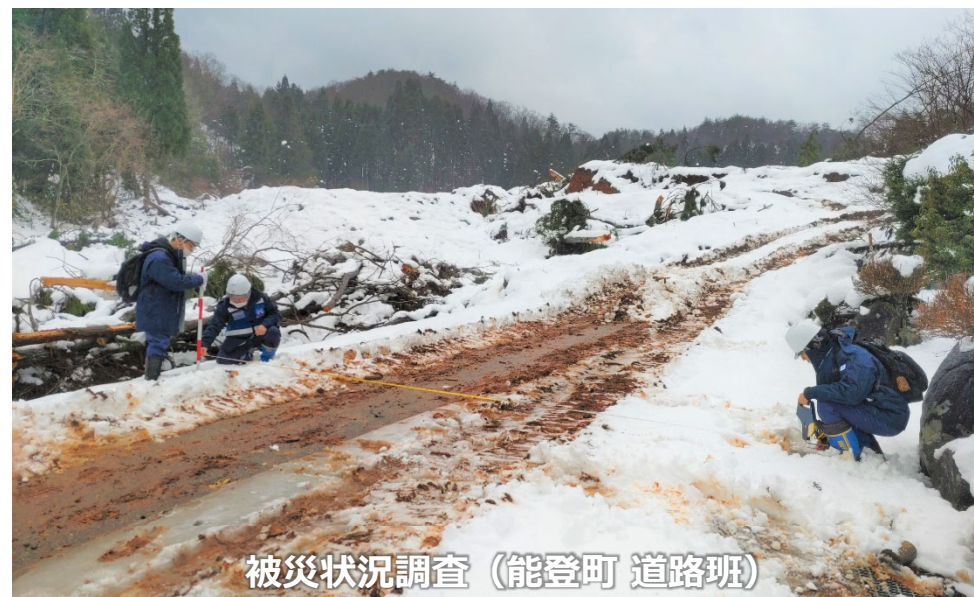
被災状況調査（能登町 道路班）