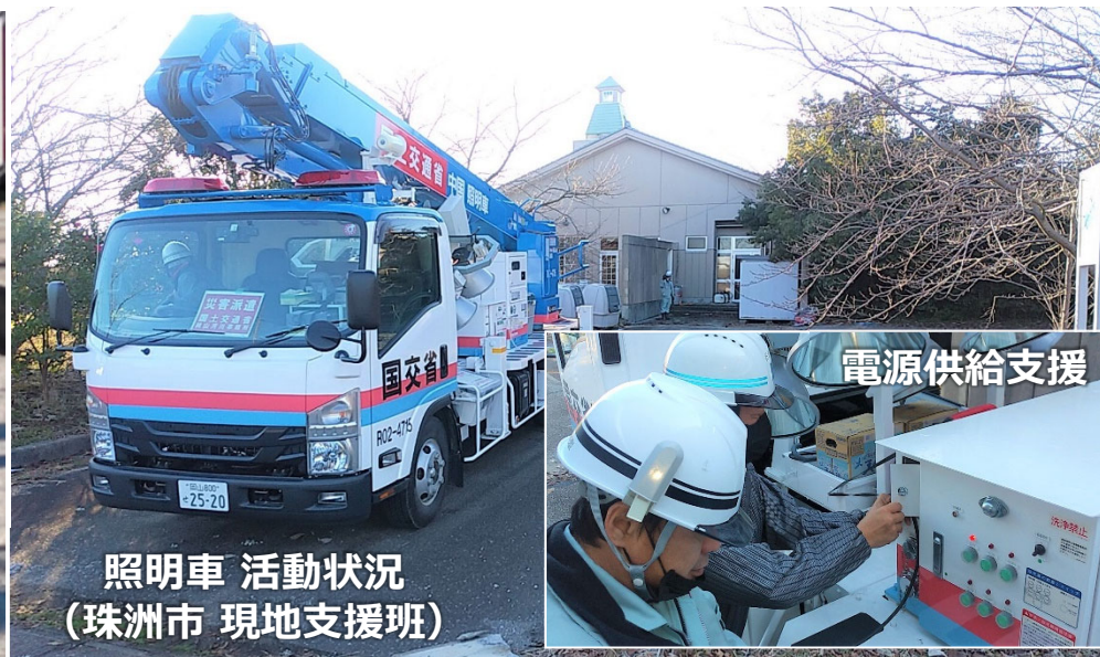
照明車 活動状況 (珠洲市 現地支援班)