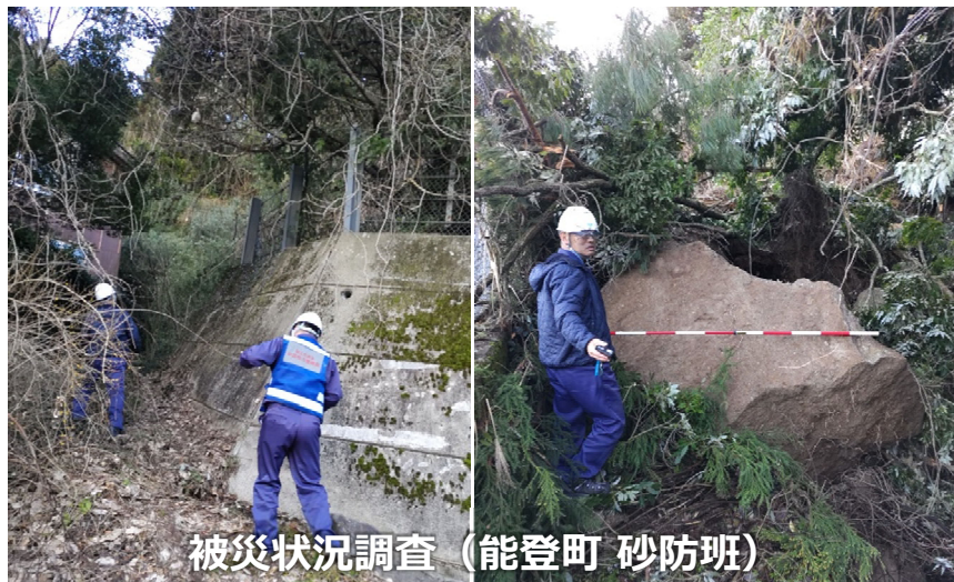
被災状況調査 (能登町 砂防班)

「TEC-FORCE派遣状況」 1月11日(木) 14班・48名 のべ199人・日 (1/4~1/11)