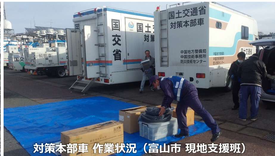
対策本部車 作業状況 (富山市 現地支援班)