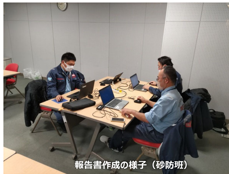
報告書作成の様子 (砂防班)