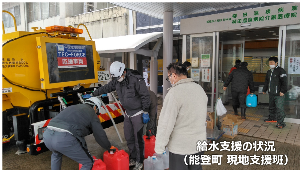
給水支援の状況 (能登町 現地支援班)