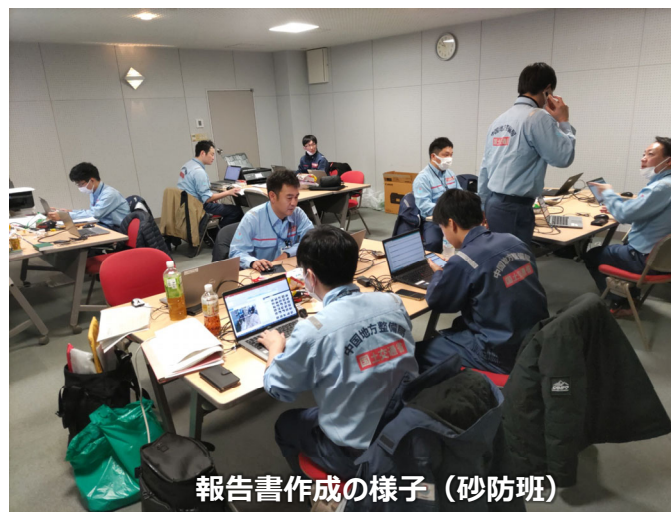
報告書作成の様子 (砂防班)