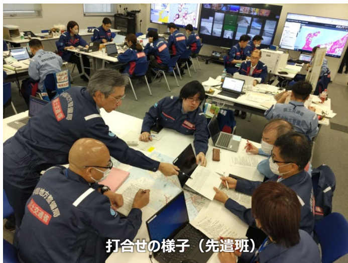
打合せの様子 (先遣班)

「TEC-FORCE派遣状況」 1月13日(土) 15班・51名 のべ301人・日 (1/4~1/13)