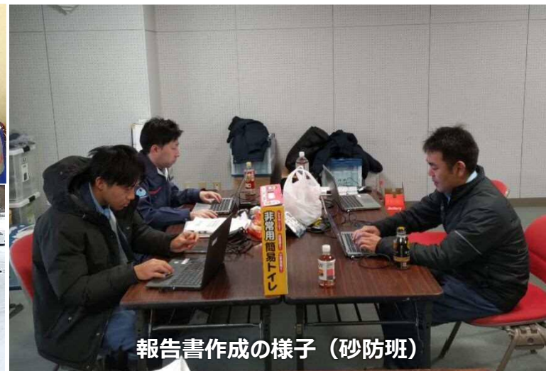
報告書作成の様子（砂防班）