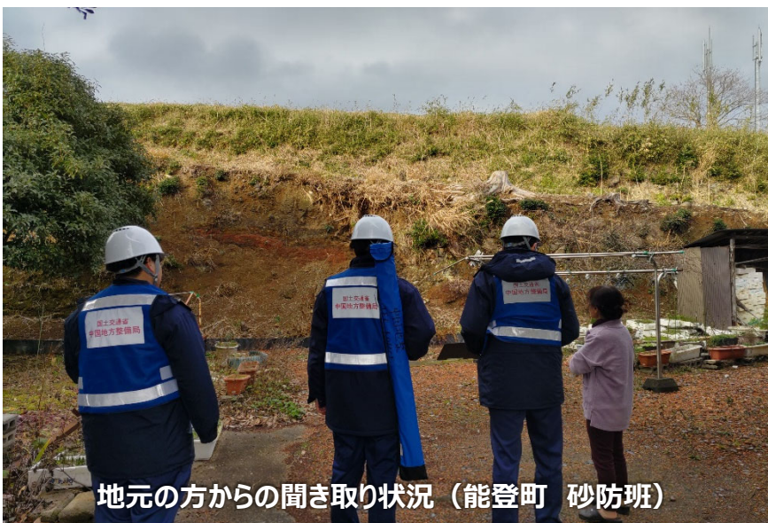
地元の方からの聞き取り状況（能登町 砂防班）