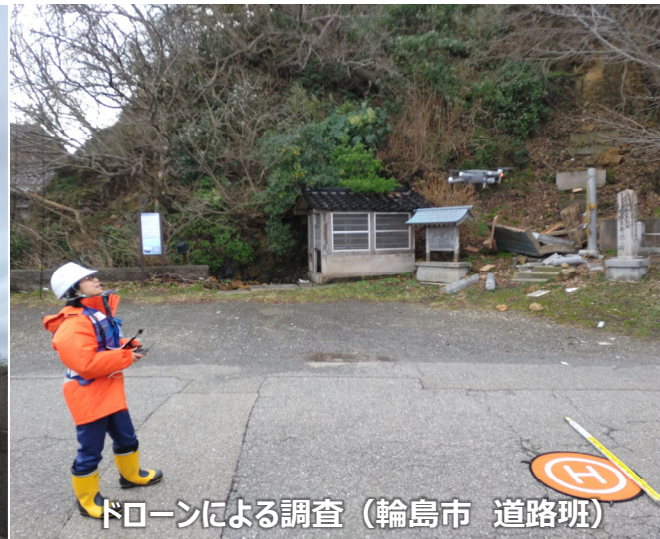
ドローンによる調査（輪島市 道路班）