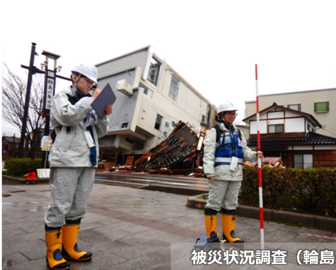
被災状況調査（輪島市 道路班）