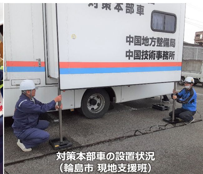
対策本部車の設置状況 （輪島市 現地支援班）