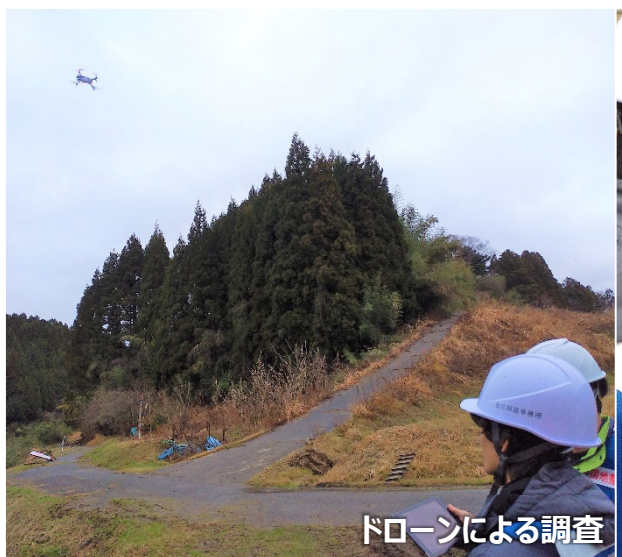
ドローンによる調査（輪島市 道路班）