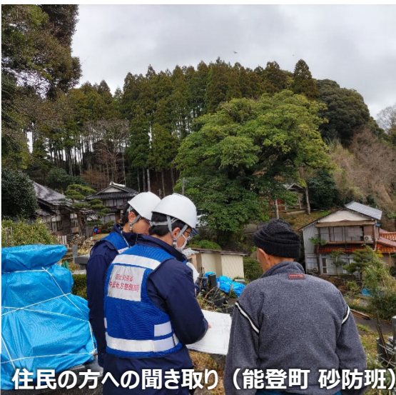
住民の方への聞き取り（能登町 砂防班）