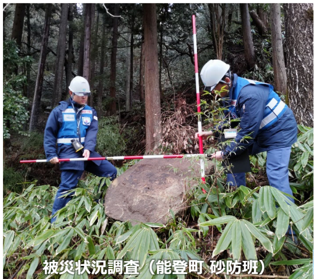
被災状況調査（能登町 砂防班）

◀TEC-FORCE派遣状況▶ 1月22日（月）12班・46名 のべ749人・日（1/4～1/22）