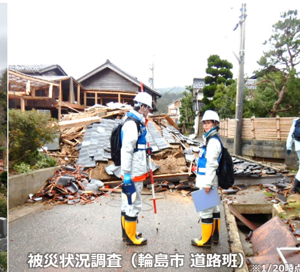
被災状況調査（輪島市 道路班） ※1/20時点