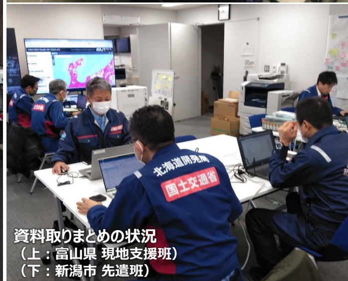
資料取りまどめの状況 （上：富山県 現地支援班） （下：新潟市 先遣班）