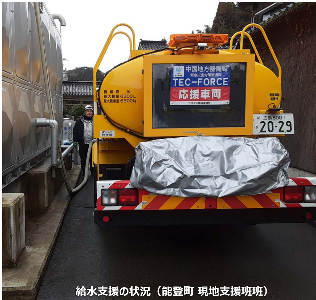
給水支援の状況（能登町 現地支援班班）

「TEC-FORCE派遣状況」 1月23日（火）13班・46名 のべ795人・日（1/4～1/23）