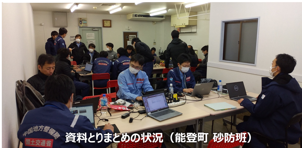
資料とりまとめの状況（能登町 砂防班）