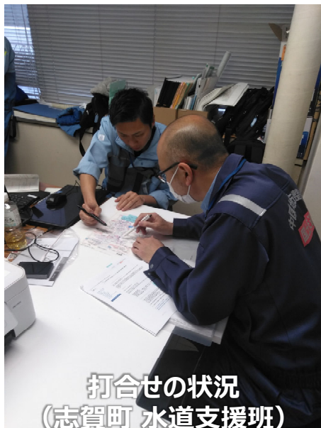
打合せの状況 (志賀町 水道支援班)

《TEC-FORCE派遣状況》 1月24日（水）13班・46名 のべ841人・日（1/4～1/24）