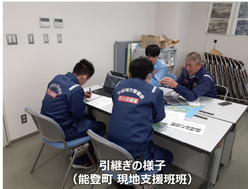
引継ぎの様子 (能登町 現地支援班)