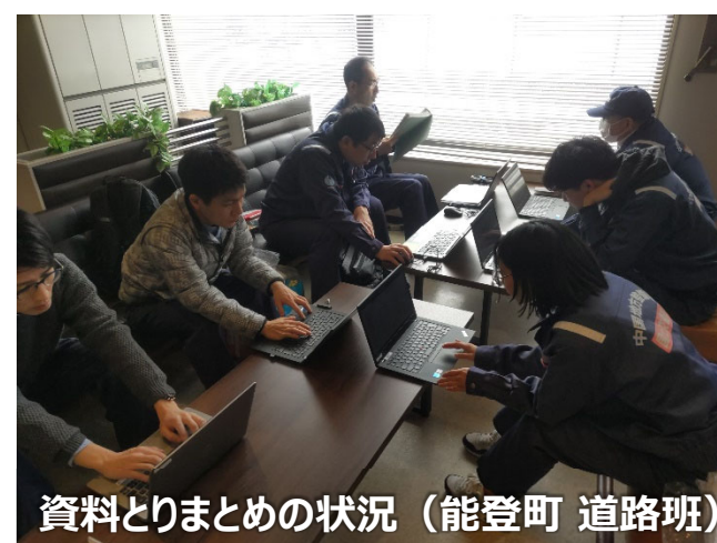
資料とりまとめの状況（能登町 道路班）