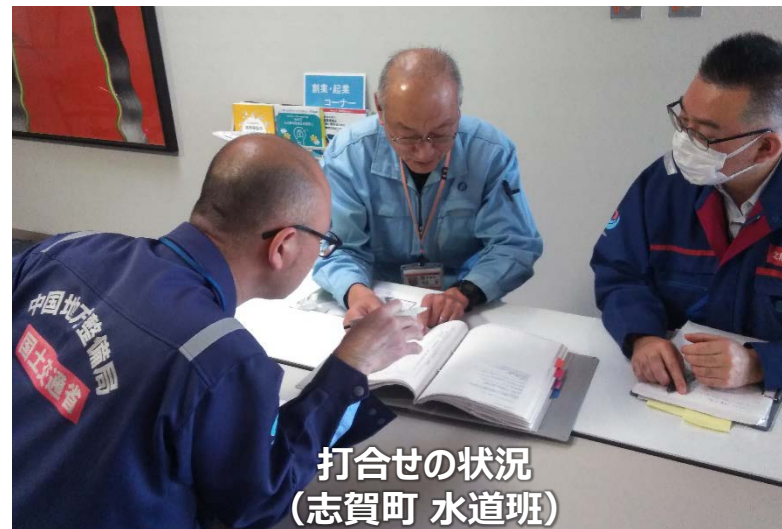
打合せの状況 (志賀町 水道班)