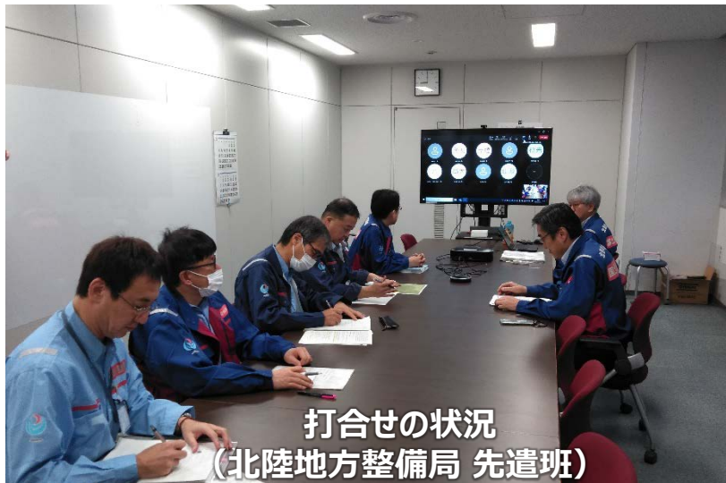
打合せの状況 (北陸地方整備局 先遣班)

「TEC-FORCE派遣状況」 1月25日(木) 13班・46名 のべ887人・日 (1/4~1/25)