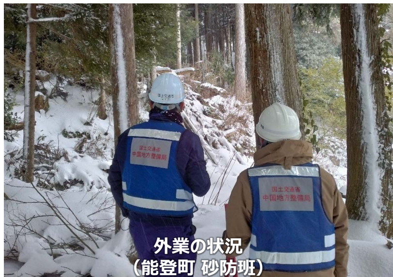
外業の状況 (能登町 砂防班)