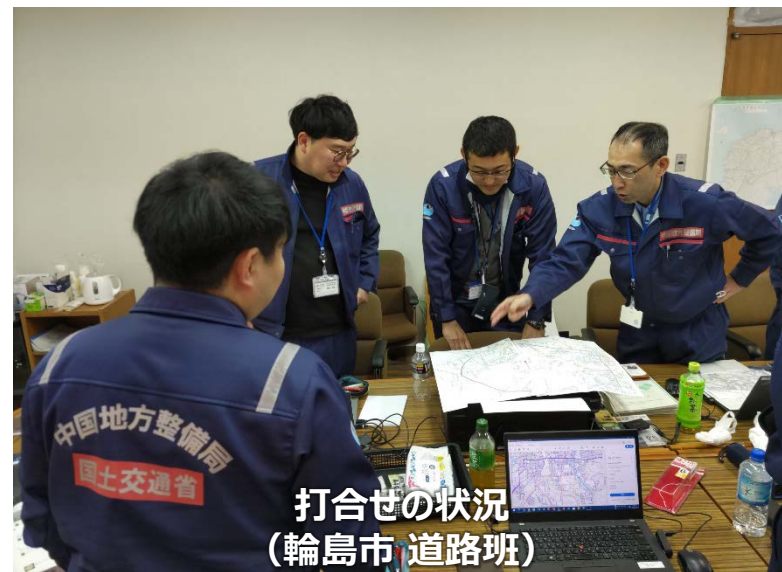
打合せの状況 (輪島市 道路班)