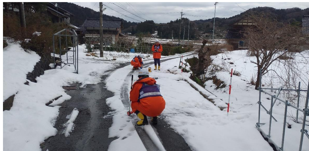
被災状況調査(輪島市西脇町 道路班)