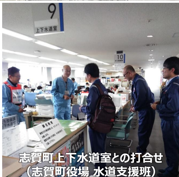
志賀町上下水道室との打合せ (志賀町役場 水道支援班)