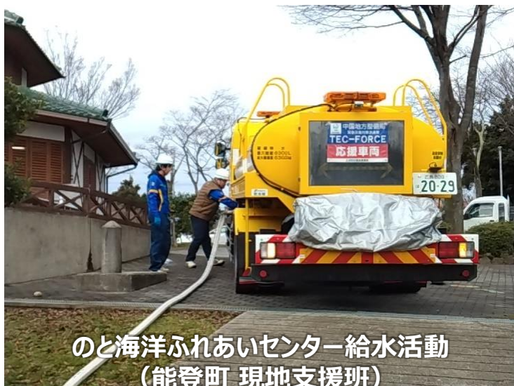
のと海洋ふれあいセンター給水活動 (能登町 現地支援班)

◀TEC-FORCE派遣状況▶ 1月29日(月) 13班・46名 のべ1,071人・日 (1/4~1/29)