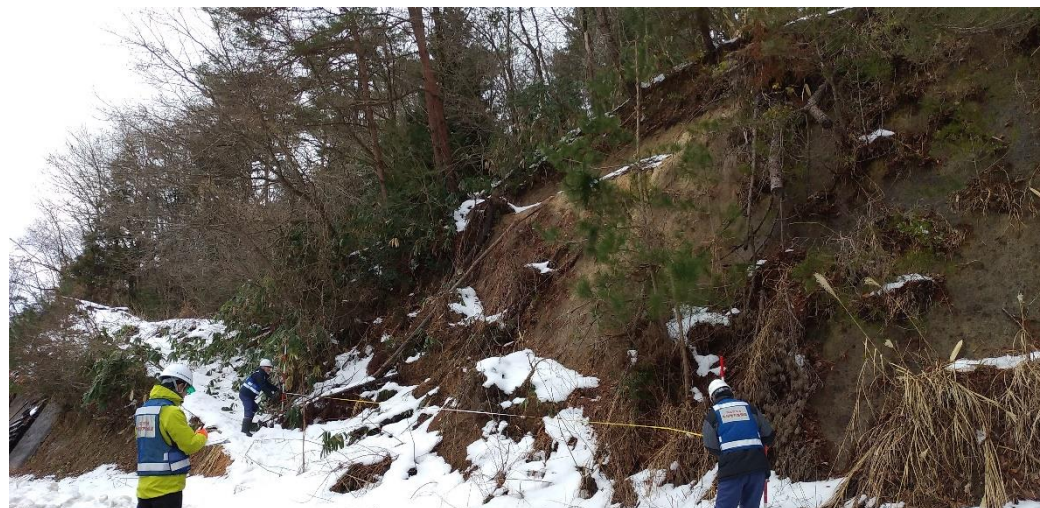
被災状況調査(能登町字字出津山分 砂防班)