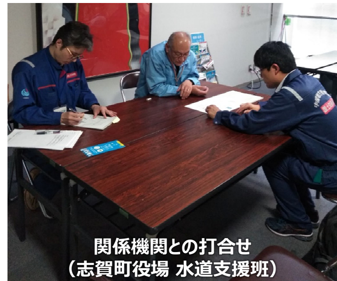
関係機関との打合せ （志賀町役場 水道支援班）