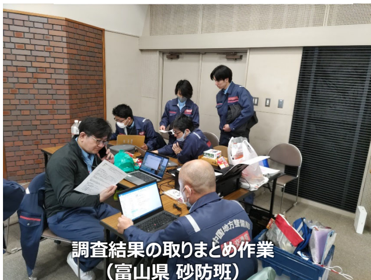
調査結果の取りまとめ作業 （富山県 砂防班）