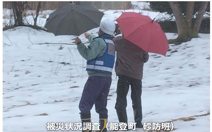
被災状況調査（能登町 砂防班）