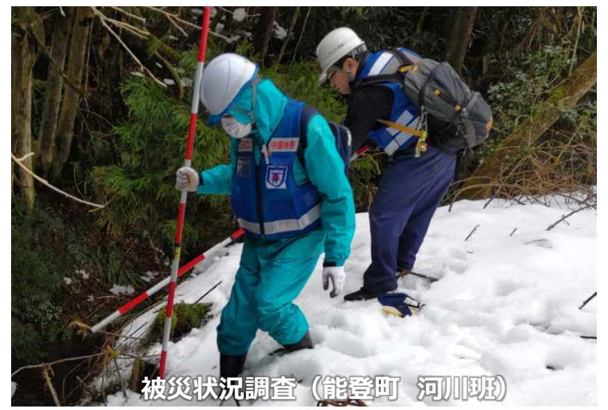
被災状況調査（能登町 河川班）