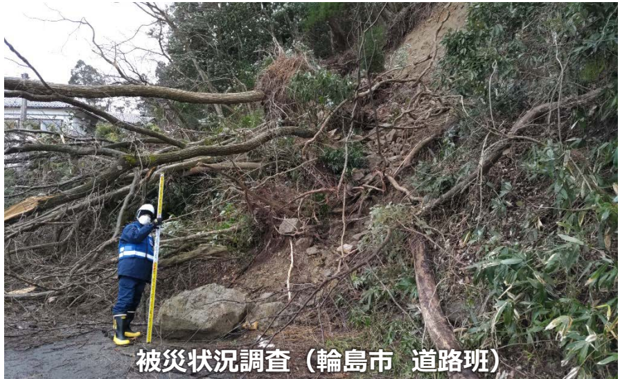
被災状況調査（輪島市 道路班）

◀TEC-FORCE派遣状況▶ 2月1日（木）10班・31名 のべ1,194人・日（1/4～2/1）