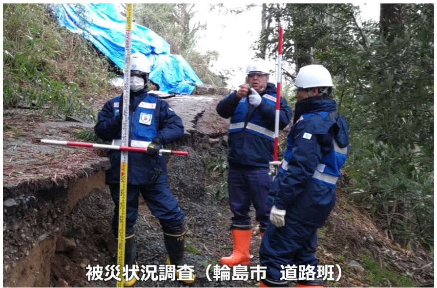
被災状況調査（輪島市 道路班）