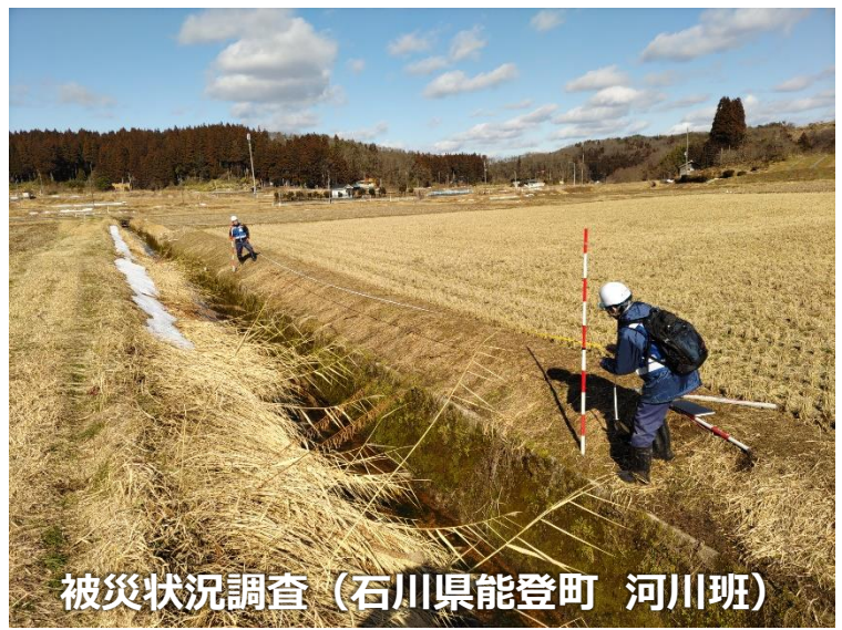
被災状況調査 (石川県能登町 河川班)