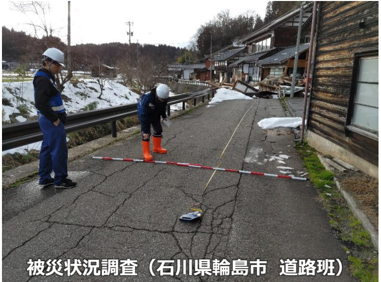
被災状況調査 (石川県輪島市 道路班)

◀TEC-FORCE派遣状況▶ 2月4日(日) 9班・29名 のべ1,284人・日 (1/4~2/4)