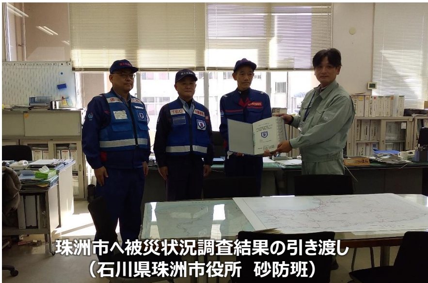
珠洲市へ被災状況調査結果の引き渡し (石川県珠洲市役所 砂防班)