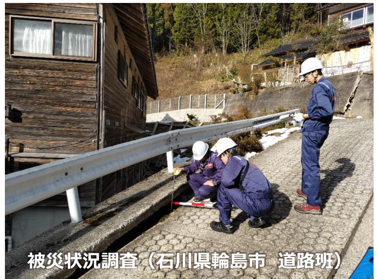
被災状況調査 (石川県輪島市 道路班)