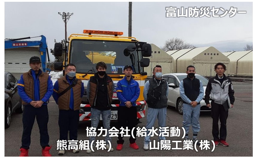
協力会社(給水活動) 熊高組(株) 山陽工業(株)