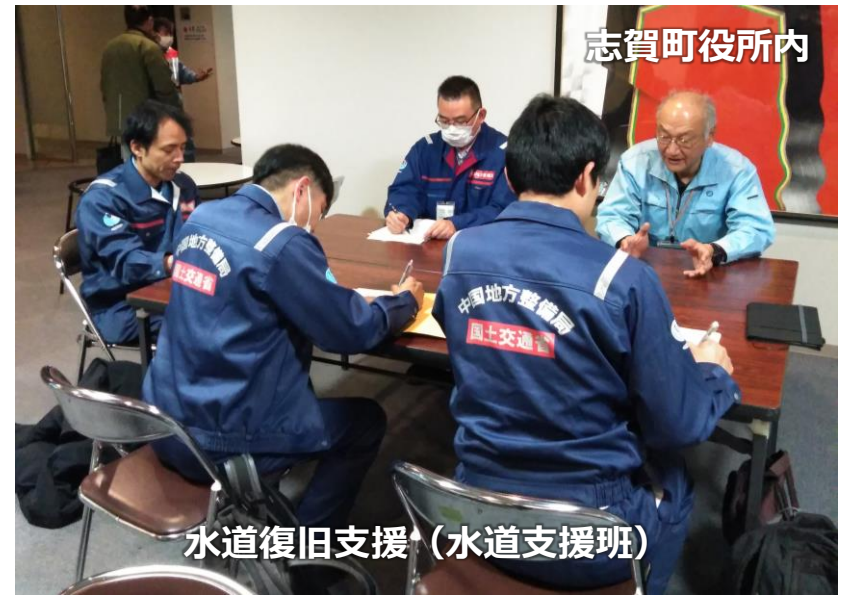
水道復旧支援 (水道支援班)