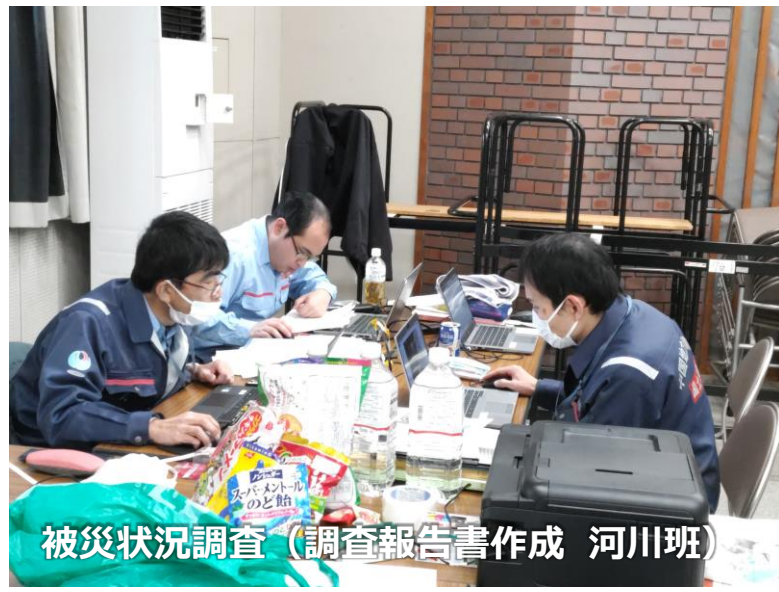
被災状況調査 (調査報告書作成 河川班)