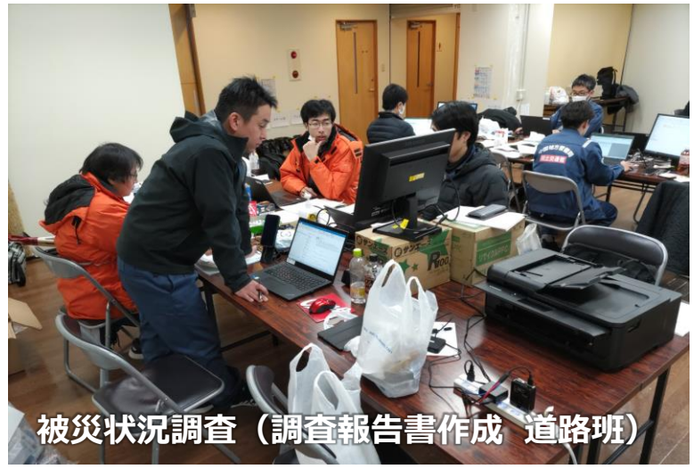
被災状況調査 (調査報告書作成 道路班)

「TEC-FORCE派遣状況」 2月5日(月) 10班・30名 のべ1,314人・日 (1/4~2/5)