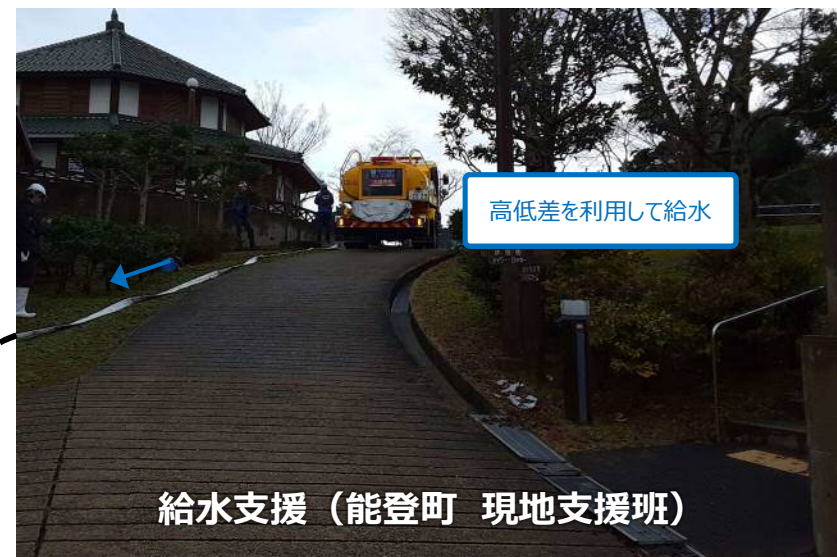
給水支援 (能登町 現地支援班)