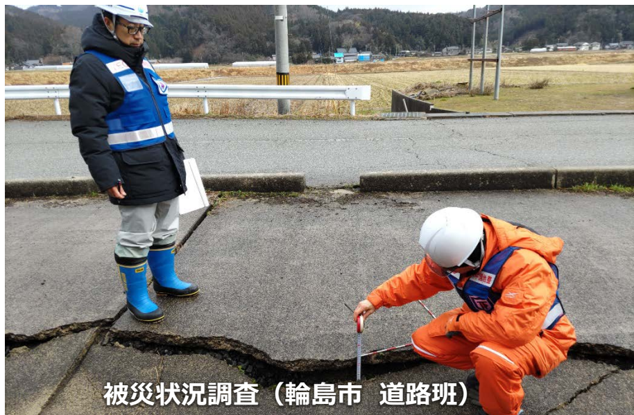
被災状況調査 (輪島市 道路班)