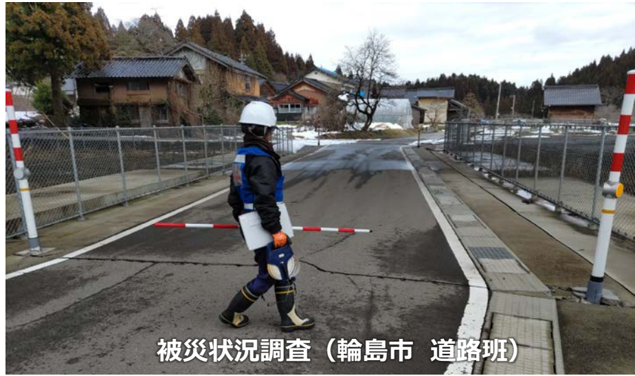
被災状況調査 (輪島市 道路班)