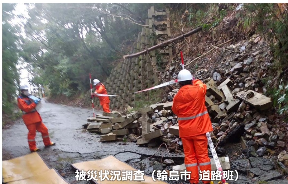
被災状況調査 (輪島市 道路班)