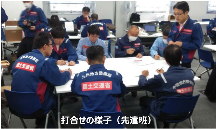
打合せの様子 (先遣班)

「TEC-FORCE派遣状況」 2月8日(木) 7班・21名 のべ1,394人・日 (1/4~2/8)