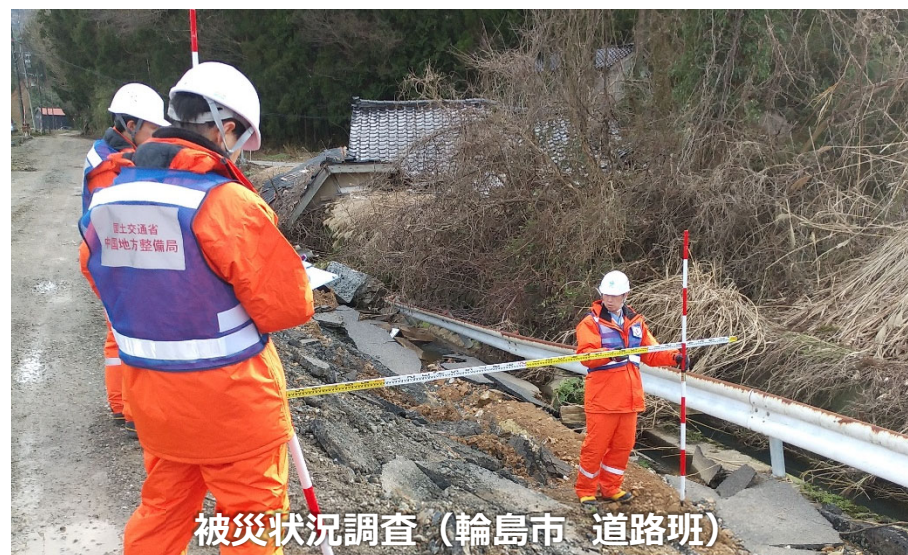
被災状況調査（輪島市 道路班）