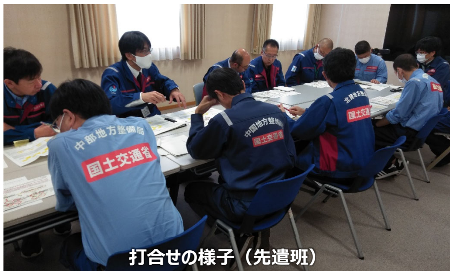
打合せの様子（先遣班）

◀TEC-FORCE派遣状況▶ 2月9日（金）7班・20名 のべ1,414人・日（1/4～2/9）