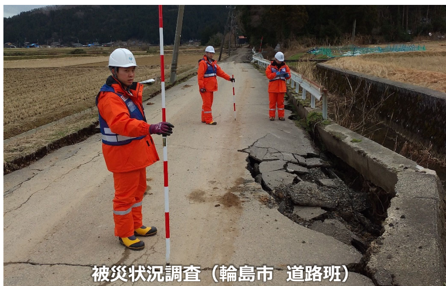
被災状況調査（輪島市 道路班）