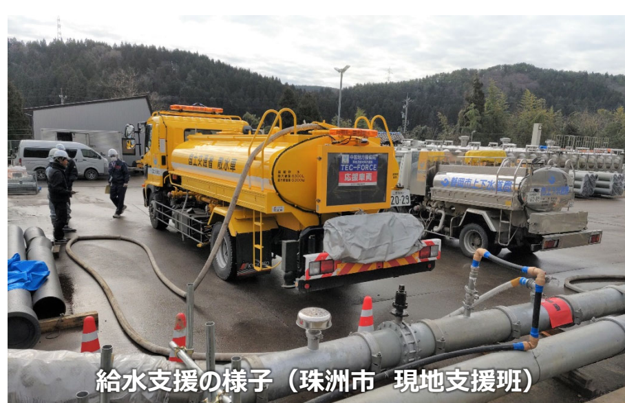
給水支援の様子（珠州市 現地支援班）