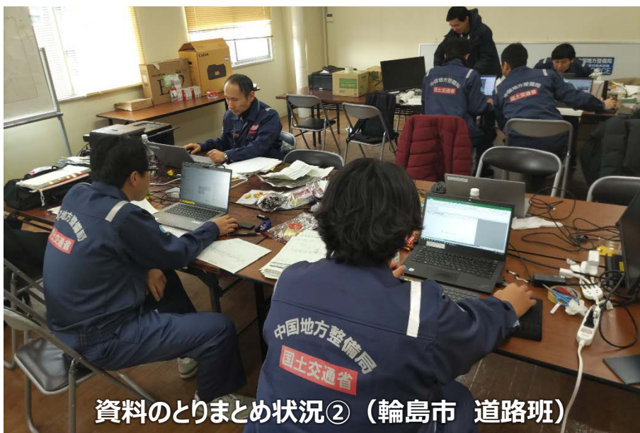
資料のとりまとめ状況② (輪島市 道路班)