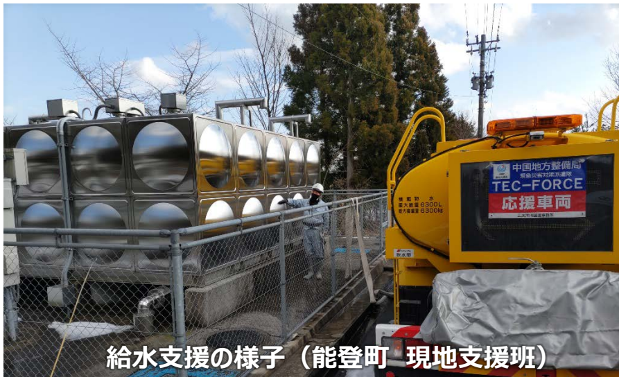
給水支援の様子 (能登町 現地支援班)

「TEC-FORCE派遣状況」 2月10日 (土) 7班・20名 のべ1,434人・日 (1/4~2/10)