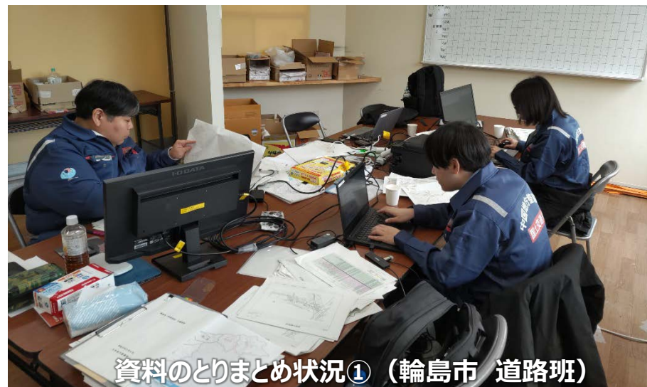
資料のとりまとめ状況① (輪島市 道路班)