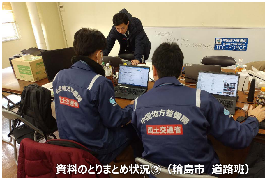
資料のとりまとめ状況③ (輪島市 道路班)