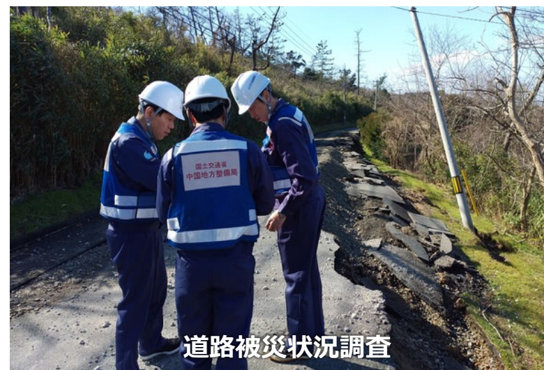
道路被災状況調査