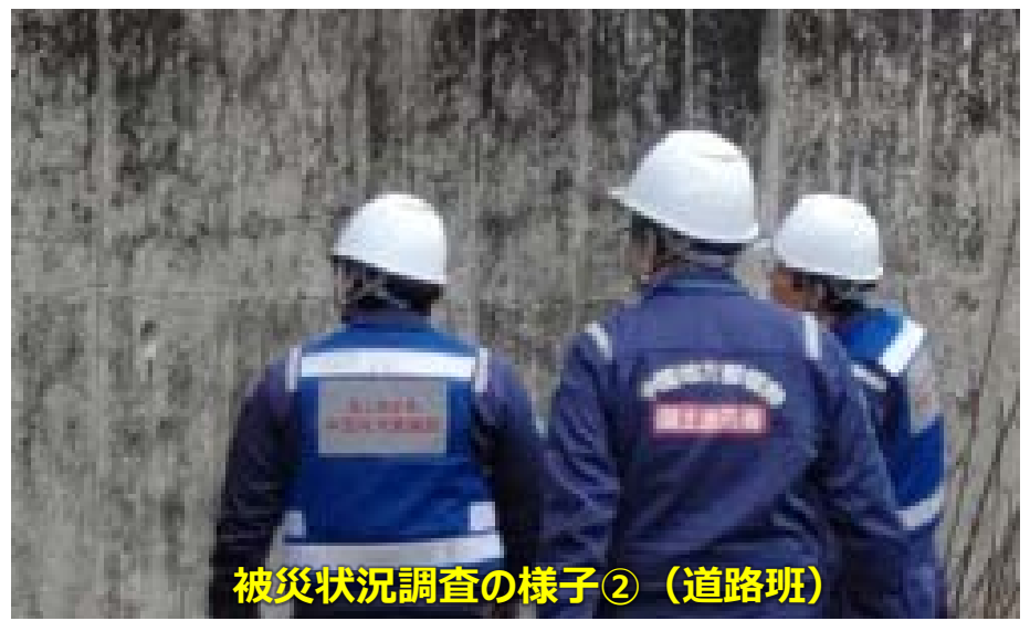
被災状況調査の様子②（道路班）