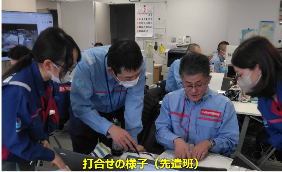
打合せの様子（先遣班）

「TEC-FORCE派遣状況」 2月15日（木）7班・20名 のべ1,533人・日（1/4～2/15）