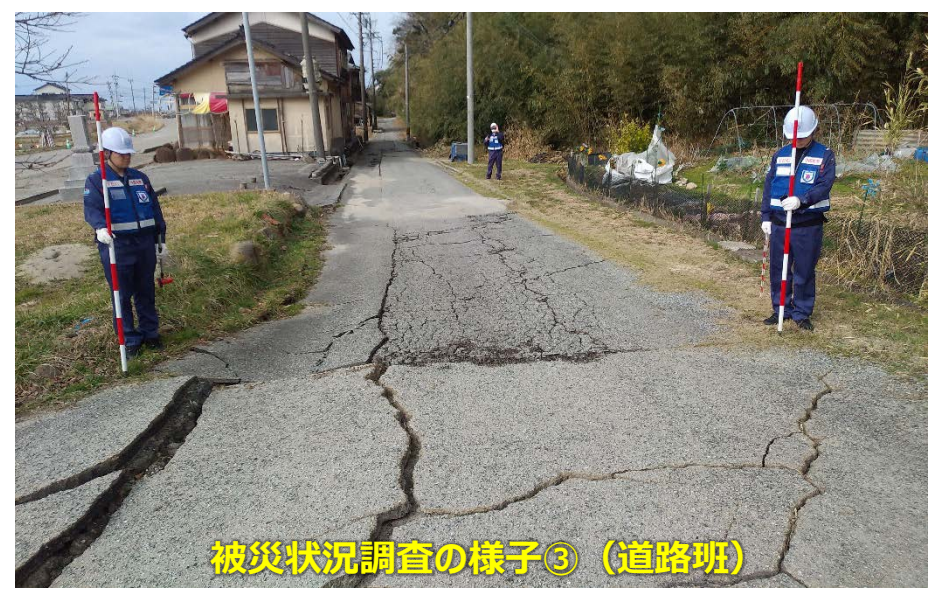
被災状況調査の様子③（道路班）