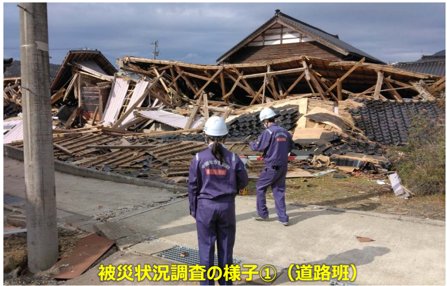
被災状況調査の様子①（道路班）