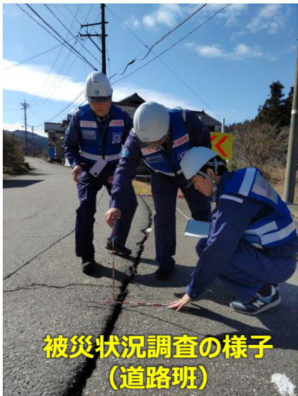
被災状況調査の様子 (道路班)