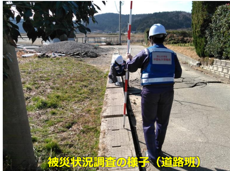
被災状況調査の様子 (道路班)