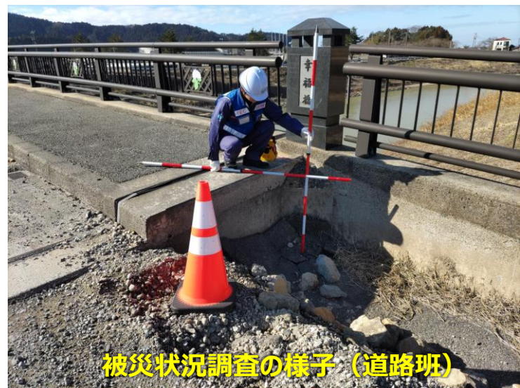
被災状況調査の様子 (道路班)