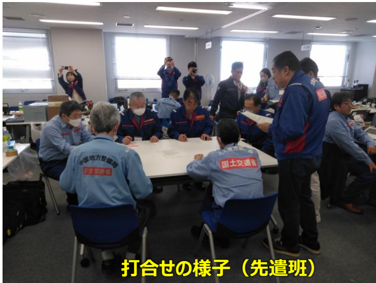
打合せの様子 (先遣班)

「TEC-FORCE派遣状況」 2月17日 (土) 7班・20名 のべ1,573人・日 (1/4~2/17)