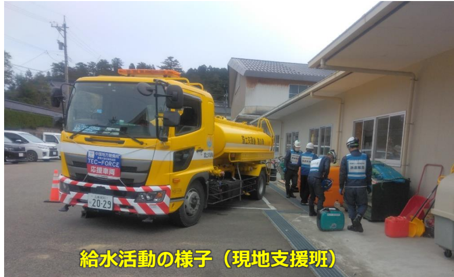
給水活動の様子（現地支援班）