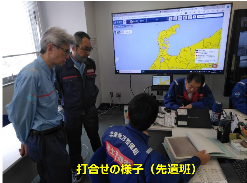
打合せの様子（先遣班）

「TEC-FORCE派遣状況」 2月19日（月）7班・20名 のべ1,611人・日（1/4～2/19）