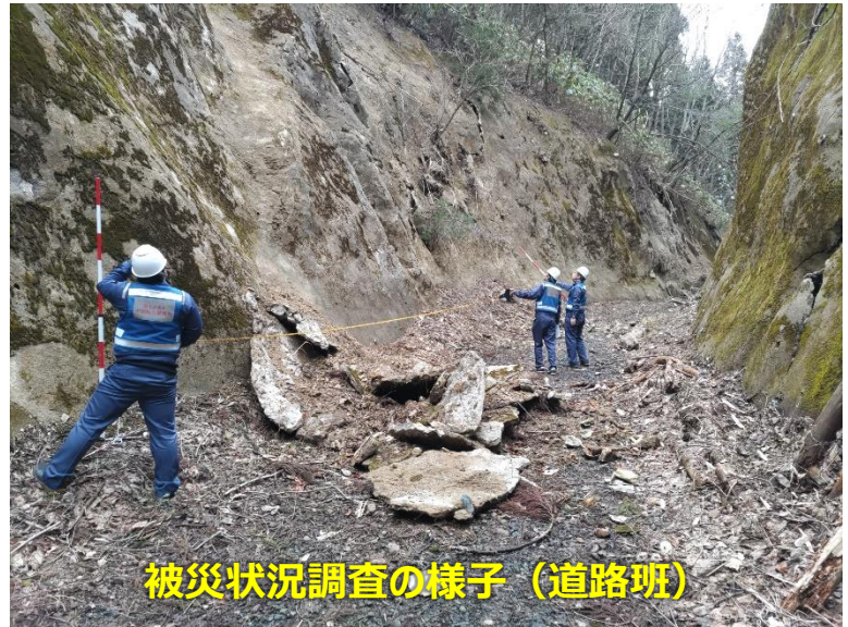
被災状況調査の様子（道路班）