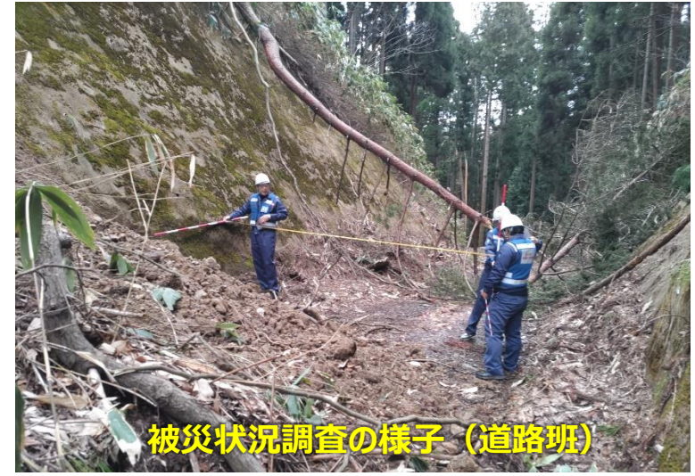
被災状況調査の様子（道路班）