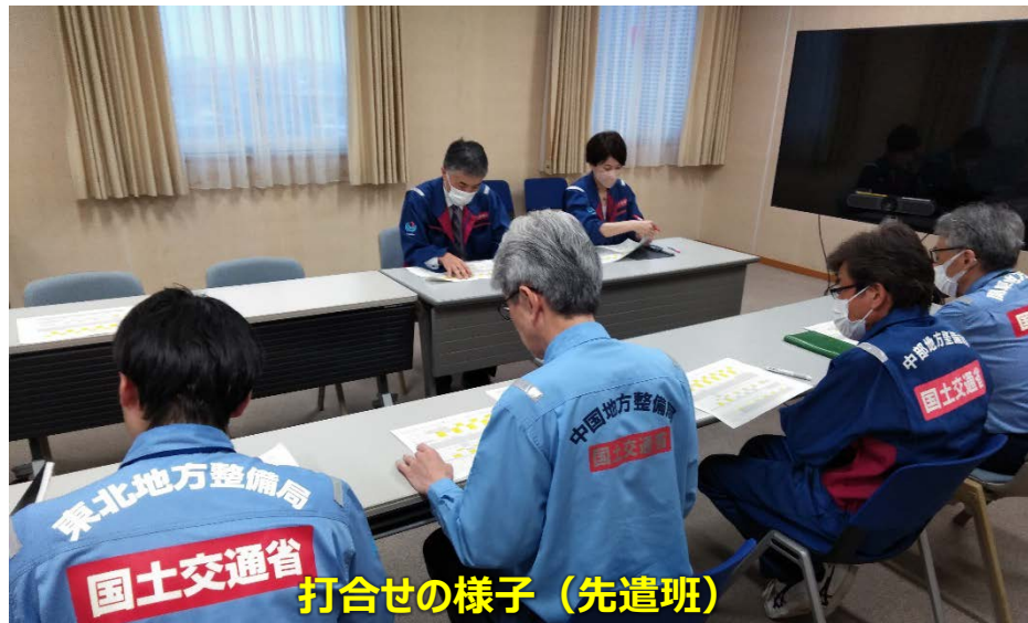
打合せの様子 (先遣班)

「TEC-FORCE派遣状況」 2月22日 (木) 6班・18名 のべ1,665人・日 (1/4~2/22)