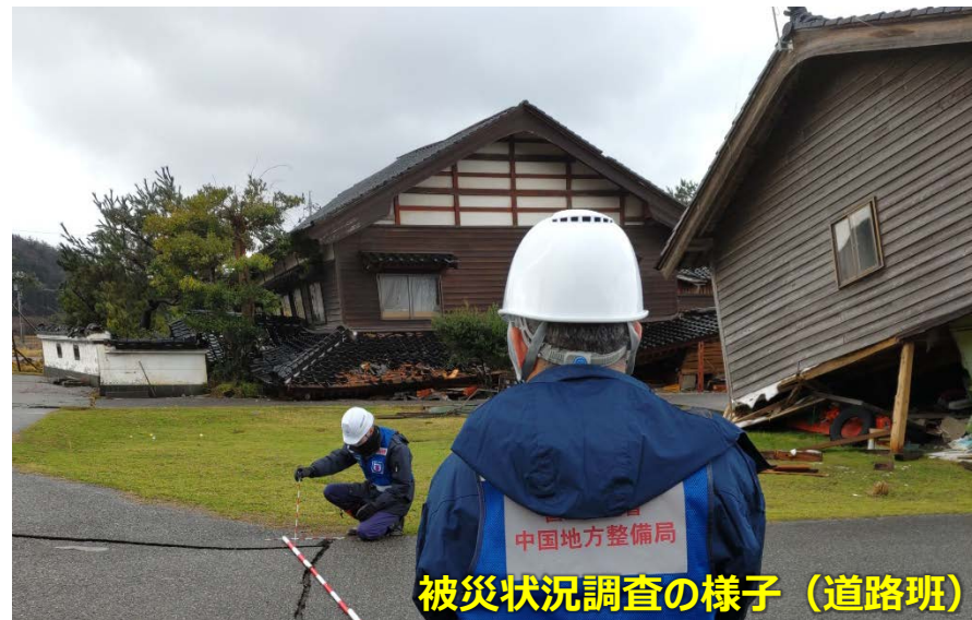
被災状況調査の様子 (道路班)