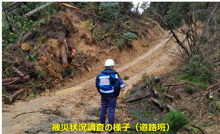
被災状況調査の様子 (道路班)