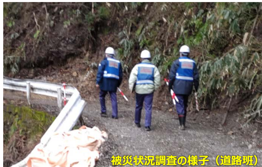
被災状況調査の様子 (道路班)