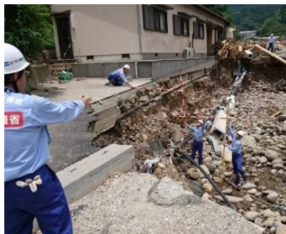
河川被害状況の調査