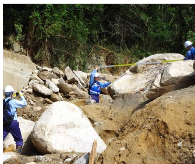
土砂災害被害状況の調査