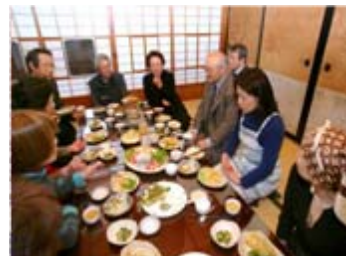
菅江真澄の日記から200年前の食を再現