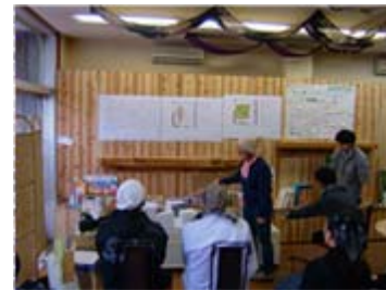
空き店舗などをまちづくり拠点「うさぎ庵」として改装