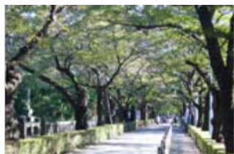
緑陰や並木のある道路での散策