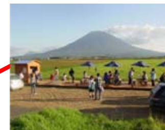
美しい景観を眺めるビューポイントで記念撮影