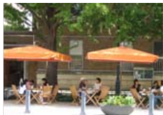
オープンカフェで街の賑わいを楽しむ