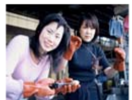
伊勢えびの捌き方講座