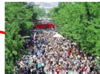
道を舞台にしたイベントを楽しむ