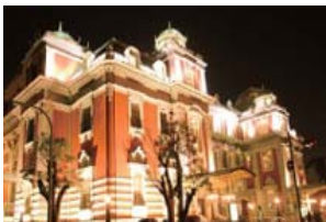
光のまちづくり～OSAKA光のルネッサンス