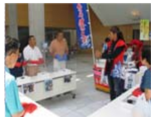
海道侍のウニ割り体験