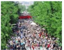
御堂筋オープンフェスタ