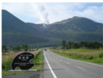
美しい風景を楽しめる道路をドライブ