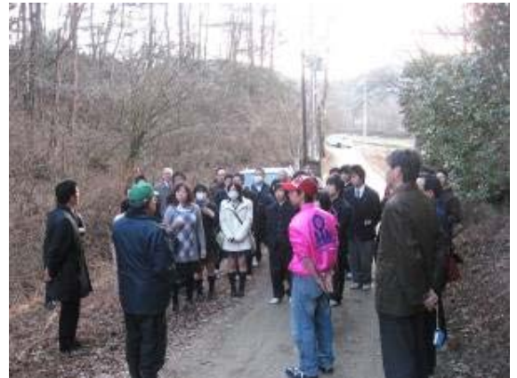
▲地域資源調査の様子