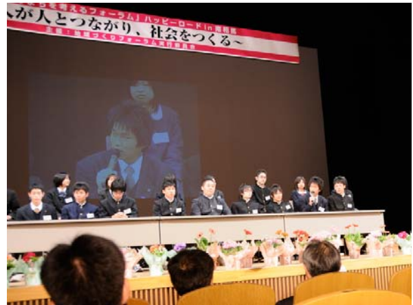
▲フォーラムの様子