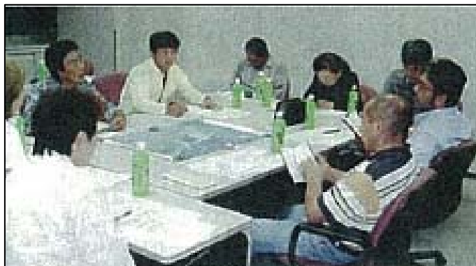
地域活動を実施するため会議を毎月開催

今後の予定は、定期的な美化活動に加え、沿道の市有地を利用した花壇づくり、志摩大橋の5周年記念イベントなどを計画しています。