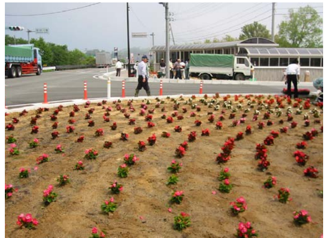
▲沿道景観の向上に向けたボランティアによる花壇の手入れ