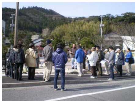
町歩きガイド講座

平成16年度から開催しているガイド養成講座では、風待ち海道協議会に参画しているまちづくりグループの方々が講師として実施してきましたが、平成20年度からは島根大学の協力によって、より専門的なジオパークガイドの養成にも取り組んでいます。