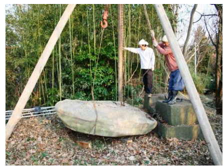
街道脇の倒れた石碑の修復作業