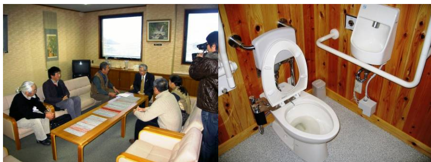
市長要望の様子と設置されたオストメイト対応トイレ

詳しい内容につきましては「ベストプラクティス集 ver.2」と「日本風景街道活動事例集【詳細版】」に掲載されていますのでそちらでご覧くださいますようお願いいたします。（※ベストプラクティス集・活動事例集は北陸の風景街道ナレッジサイトにもアップされています。）