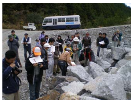
ジオツアーガイド講座