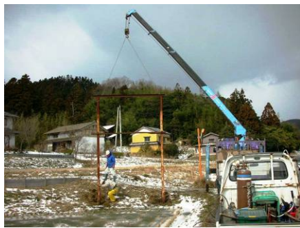
放置看板の残骸の撤去作業

重点ルートには古道や旧街道・山道のトレッキングルートがあるため、定期的に草刈りや倒木処理などの整備をするほかに、時には街道脇の倒れた石碑の復旧や痛んだ街道の砂利敷きなどの整備を行い、佐渡國しま海道の会員がガイドを勤める現地見学会やトレッキングを開催しています。