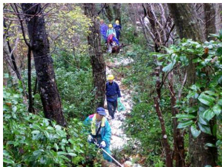
トレッキングルートの草刈