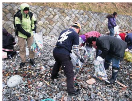
海岸清掃後のきれいになった海岸で絶叫大会！