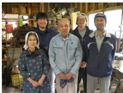
若者を雇用した黒曜石店

隠岐産の黒曜石を採掘・加工する黒曜石店では新たに二人の若者を雇用し、UIターン者で設立された旅行会社「隠岐旅工舎」では、着地型の旅行商品の販売とともに隠岐の島町の中心部を流れる八尾側の「かっぱ遊覧船」も運航しています。