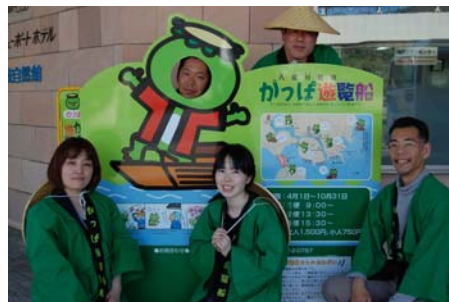
隠岐旅工舎のスタッフ