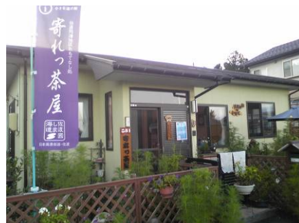
青いのぼり旗が目印の「寄れっ茶屋」