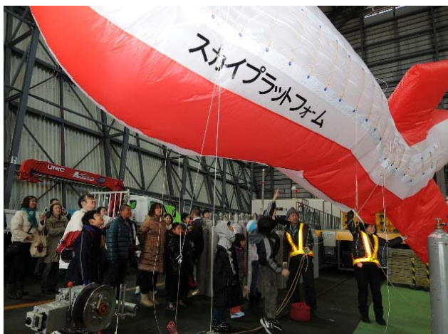
交流会 航空宇宙公園見学(大樹町JAXA)

また、平成 23 年 12 月には、札幌の子ども達との交流会を実施しました。南十勝で作成した「子供たんけん夢マップ」を基に、南十勝ならではの施設を案内し、地元の子ども達とのふれあいを大切にしながら、学校SBWの活動を紹介しました。札幌の子ども達の満足度が高かったこと以上に、南十勝の子ども達の「おもてなしの心」が芽生えたことが、一番の成果であったと言えます。