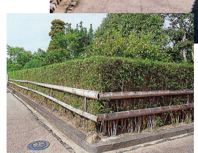
ウバメ柵・土用竹の生垣