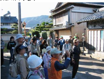
あきのいきいきウォーキングの開催