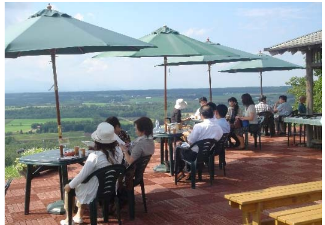
シーニックカフェちゅうるい(幕別町忠類地区)

しかし、当ルートでは、これらの活動に対し、継続性や新たな視点・発想の導入が必要であると感じていました。そして、これらの活動を継続・発展させるためには、古くからの団体やメンバーからの世代交代を円滑に進める必要があると考えました。そこで、ルート活動のテーマである「夢を育む海と大地と清流のみち」実現のため、地域の子供達にシーニックバイウェイの思想を伝え、地域の事を子ども目線で考えることにより、子供達にとって夢ある地域づくりを目指した、「学校シーニックバイウェイ」(以下、学校SBW)の取り組みを地元忠類小学校の協力の基、開始することとしました。