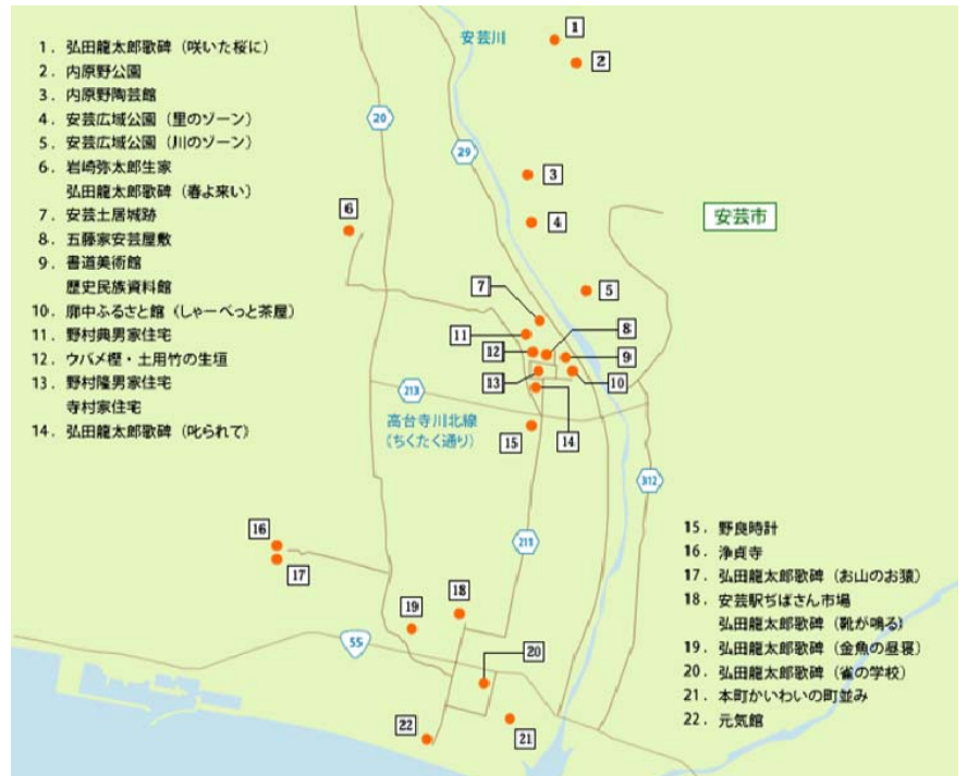
土居廓中案内マップ

しかしながら、主要な観光地が市内各地に点在しているうえ、観光地をつなぐ道路も交通量のわりに狭隘なものが多いため、目的地まで適切に誘導できる分かりやすい案内標識などを整備し、観光客に極カストレスを感じさせない周遊ルートを設定する必要がありました。