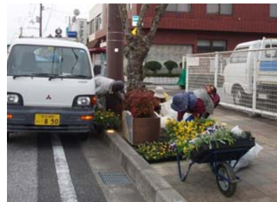
植栽の支援(花の種など購入)