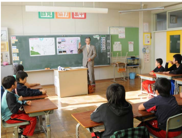
学校SBW 授業風景(SBW思想の継承)

さらに、マップを使用して自分の地域をPRし、地域活性化を目指すことも重要と考えました。他地域の同年代の子ども達が自分の住む地域を訪れた時に、作成したマップを元に地域を案内しPRする機会が得られることで、自分の住む地域への自慢や誇りを持つことができるからです。