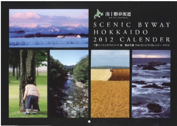
南十勝夢街道 2012 カレンダー

当ルートには、自然や農村景観をはじめ歴史や文化等の豊富な地域資源があり、これを守るとともに、地域の魅力向上のために、活動団体を中心とした花植活動、清掃活動を実施しています。さらに特徴的な活動として、フォトコンテストを実施し入賞作品をメインにしたカレンダーを制作販売し、この地区への訪れる機会を作るための活動や、景観の美しい場所にシーニックカフェを開き、ボランティアメンバーが、訪れる人に無料の飲み物、エリア情報、癒しの空間を提供する活動等を展開してきました。