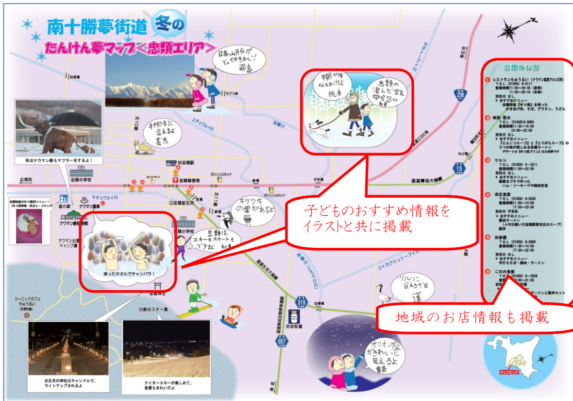
学校SBW 子ども達が考えたマップ