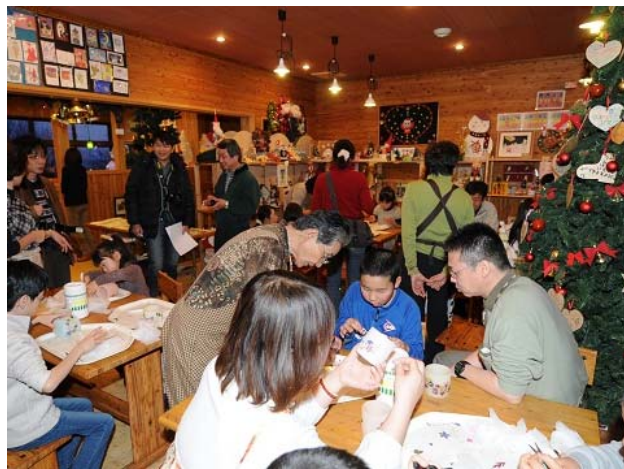
交流会 クリスマスキャンドル作り(広尾町サンタランド)