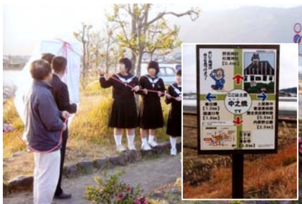
観光情報板の設置