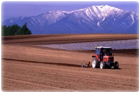
春の日高山脈(中札内村)

「南十勝夢街道」は、北海道のほぼ中央部にある十勝平野の南に位置し、ルート内には地域のどこからでもその雄大な姿を望むことが出来る日高山脈が連なり、そこから流れ出る幾つもの清流が太平洋へと注ぐ景観を形成しています。その清流の途中には、日高山脈からの恵みを背景とした豊かな農村景観が広がり、これらの豊かな自然環境や農村景観はルートの特徴となっています。