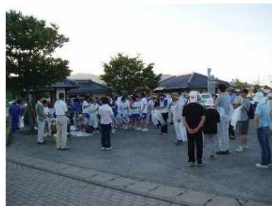
清掃活動の支援(清掃用具購入)