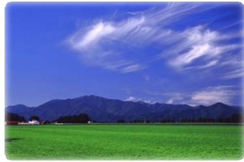
夏の日高山脈(更別村)

当ルートは、中札内村、更別村、幕別町忠類地区、大樹町及び広尾町の5町村を所管とする地域の37団体で構成され、「夢を育む海と大地と清流のみち」を活動のテーマとして、素晴らしい環境を大切にし、歴史と文化を活かしながら地域活性化を目指しています。そして、地域の子供たちに夢を与え、その子供たちが大人になってからも住み続けたい・守り続けたいと思えるような地域づくりを目標としています。