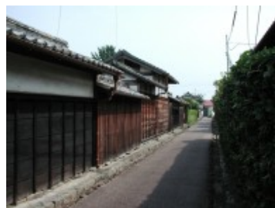
藩政時代の武家屋敷