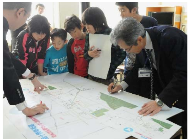
学校SBW 授業風景(マップ作成)