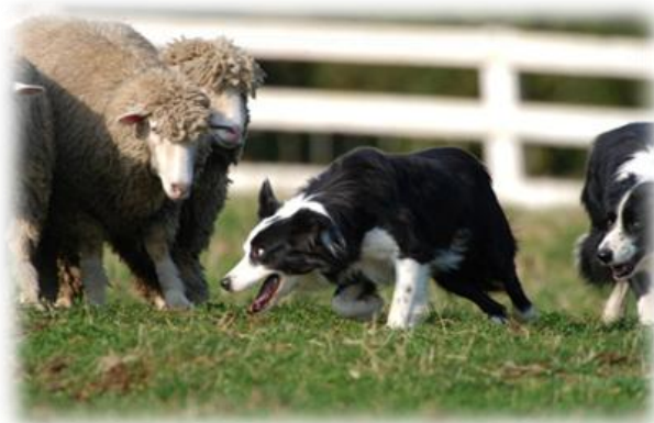
ボーヤ・ファーム(池田町)

ご当地観光情報センターの実現に向けルート活動に参加する施設でお得なサービスが受けられるチケットの販売等の企画作りや十勝の魅力・生活の楽しみを伝える「ライフコンシェルジュ(ご当地風土アドバイザー)」の育成などを行っています。