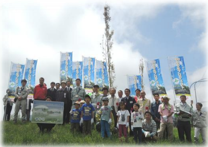
北海道コカ・コーラボトリング(株)様との共催記念植樹

今年度は(株)ニトリ様、(有)高橋商事様からご協力を頂くとともに、北海道コカ・コーラボトリング(株)様の賛同と企業協賛による初めての共催記念植樹もおこなわれました。今後も地域や企業との連携を強め、引き続き植樹や維持管理を行っていく予定です。