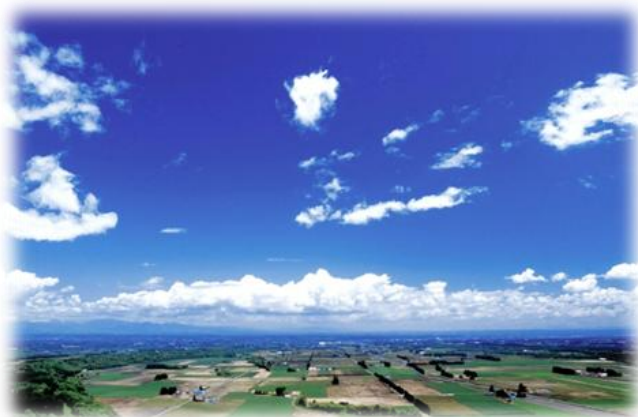
新嵐山展望台(芽室町)から望む十勝平野