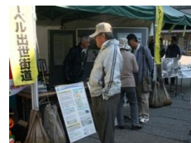
風景街道紹介ブース