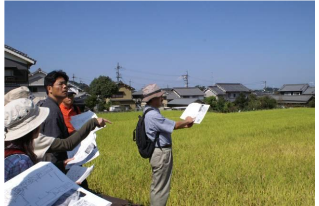
語り部つあー（明日香村周辺）