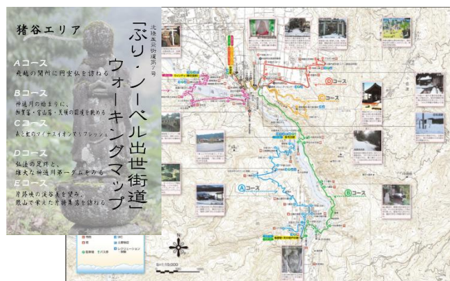
ウォーキングマップ