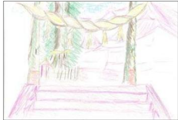
参加者の作品(大神神社)