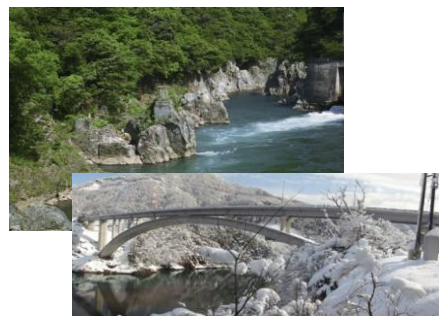
四季で違う風情を見せる神通峡

神通峡は、岐阜県の飛騨高地(中部山岳)に源を発し、神通川の激流が造り上げた、鋭いV字を成す美しい渓谷です。その美しい姿とは裏腹に、かつての街道では、断崖絶壁の中を人ひとり歩くのがやっとという、難所中の難所でした。四季折々で違う風情を見せるその姿は、景勝地として多くの人を引きつけています。