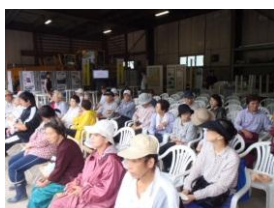
除雪 ST 活用状況