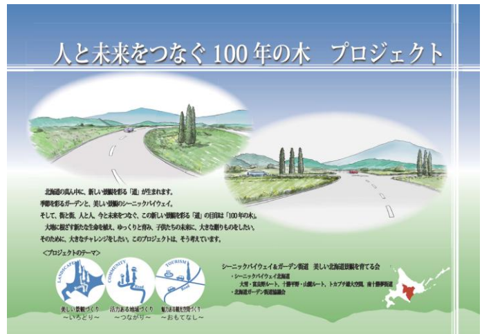
人と未来をつなぐ100年の木プロジェクト

「人と未来をつなぐ100年の木プロジェクト」は、100年後の道路景観を創り、子供たちの未来に大きな贈り物をしたいという想いから、シーニックバイウェイ北海道の4つのルート(大雪・富良野ルート、十勝平野・山麓ルート、トカプチ雄大空間、南十勝夢街道)と北海道ガーデン街道協議会が連携し、実施しています。当プロジェクトは北海道観光の道しるべとなる「サインツリー」を地域の方々と一緒に、上川から十勝間の沿線等に植えるなど、訪れる人々に、地域の要所、休憩箇所、景観の優れた箇所などを案内し、おもてなしを行うプロジェクトです。植える木は「ヤマナラシ・エレクタ」。スラリとした樹形が特徴的な樹木です。