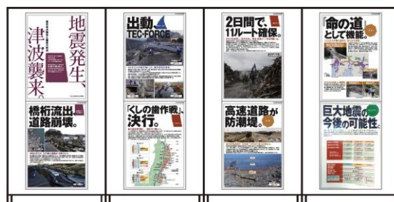
東日本大震災パネル