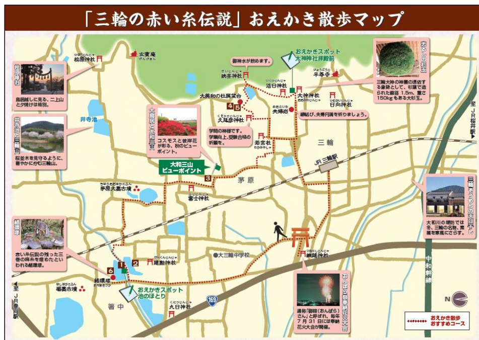
おえかき散歩マップ

参加者から「単なる歴史ウォークではなく、語り部とスケッチを組み合わせたこのようなイベントを今後も実施して欲しい。」などの意見が寄せられ、この取り組みを通じてルートの地域資源の魅力を参加者へ感じてもらうことができたところで