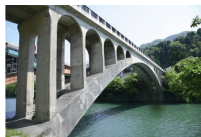
神通川にかかる笹津橋