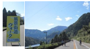
国道ウォーキングの様子

また、風景街道の紹介ブースでは、本ルートの紹介だけでなく飛騨地域のルートのパンフレットやパネルを展示し、PRを行っています。