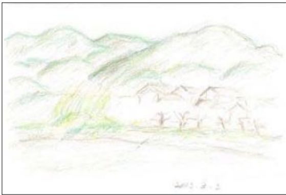
参加者の作品(池のほとり)