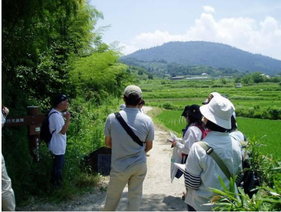
語り部つあー（山の辺の道周辺）

考古学や歴史・文学の専門家に「語り部」となっていただき、解説を聞きながら歩くウォーキングツアーを行っています。道と沿道景観を形成してきた歴史や文化をしっかりと学習し、基礎知識を持って歩くことで、風景をより深く楽しむことができます。