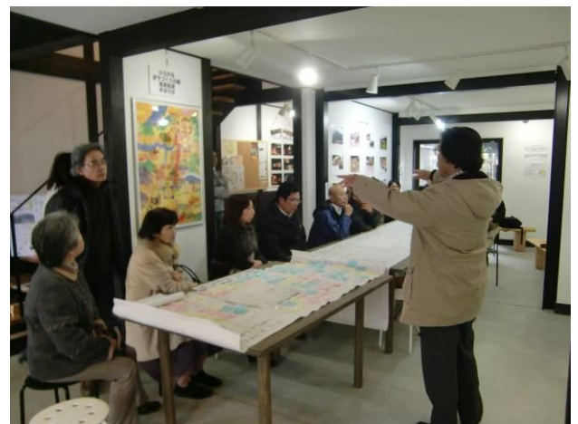
語り部によるギャラリートーク