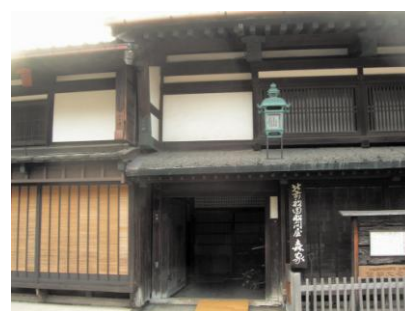
回船問屋郡の残る町並み