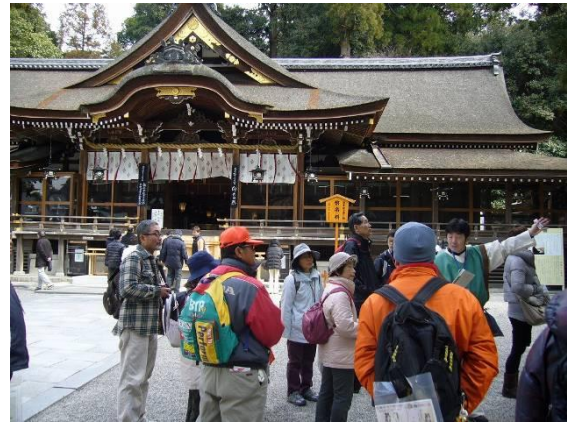
古代衣装を着た語り部による説明(大神神社拝殿前)