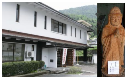
猪谷関所館と円空仏

現在の富山県と岐阜県の県境付近では、明治時代まで北陸と東海地方を結ぶ要として神通川の右岸側に東猪谷関所、左岸側には西猪谷関所が置かれていました。その内、西猪谷関所跡には現在、猪谷関所館があります。ここでは、関所関係の文献や資料が展示してあるほか、円空仏をはじめとした民族資料など貴重な資料が、数多く展示され、当時の交易や人々の暮らしをしのぶことができます。