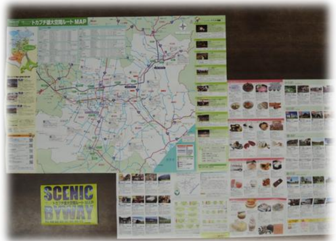
トカプチ雄大空間ルートマップ (B2版両面)

「トカプチ雄大空間の魅力をわかりやすくひとまとめにし、情報を発信したい」、そんな想いで「トカプチ雄大空間ルートマップ」は作られています。地図はもちろん、ルート内の観光ポイントやお食事処、ドライブルートの案内等、B2版両面に情報がぎっしり詰まっており、観光客の方々にはたいへん好評です。平成24年度は7万部が発行され、十勝を訪れる方々の観光ナビゲーターとして利用されており、今後も、より利用しやすい魅力的なマップを目指して、見やすさの向上や、情報の充実などを図っていく予定です。