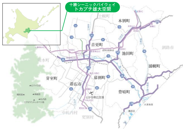
トカプチ雄大空間の活動エリア

山々に囲まれた広大で平坦な畑作酪農地帯と澄み切った大空という立体的な空間の中に帯広市をはじめとした都市と自然とが共存する地域特性から、バリエーションに富んだ様々な魅力を有するエリアとなっています。