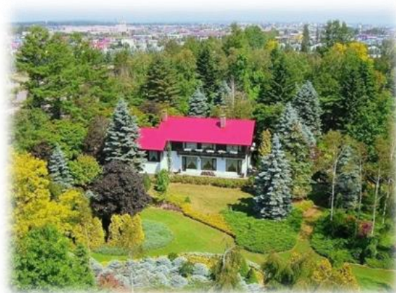
真鍋庭園(帯広市)は、まるで「おとぎの国」