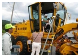
除雪機械を試乗する親子