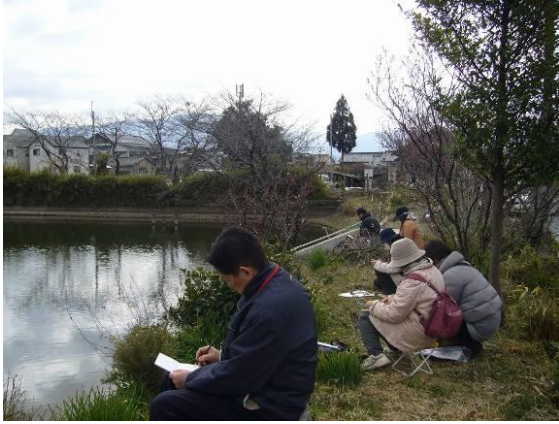
池のほとりでのスケッチ