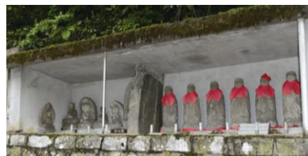
旅人の無事を祈り作られた野仏

東海と北陸を結ぶかつての飛騨街道は狭い道や断崖絶壁など難所として知られ、往来する人の無事を願って数多くの野仏(石仏)が存在し、今でも地域の人々によって大切にされています。