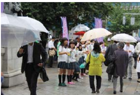
街頭PR(日本橋“滝の広場”)

将来の地域活性化を担う高校生と、地元のパートナーシップと一緒に東京日本橋へ行き、現地で同様の活動・志をもつ方々と合同で植栽活動を行うことにより、世代間交流や地域交流を深めました。