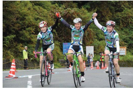
石鎚山ヒルクライム レース状況