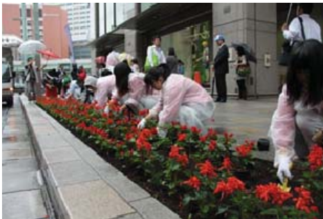
合同植栽(国道4号“三越本店前”)

平成24年10月に開催した全国サミット「風景街道サミットinあさま」をきっかけに、東京日本橋で活発に活動している“江戸・東京・みらい街道”と合同植栽活動を計画しました。当街道内の群馬県立中之条高校の生徒が育てたサルビアの花苗を提供し、日本橋での合同植栽に参加することによって、社会貢献、世代間交流、地域交流を通じて、人材育成、意識の醸成、活動の活発化が図れるとともに、活動のPRを行いました。