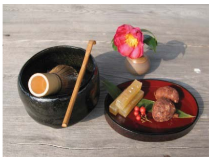
抹茶と百合の根を使った和菓子 のお茶会セット