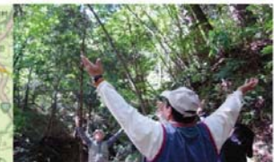
飯南町【森林セラピー】