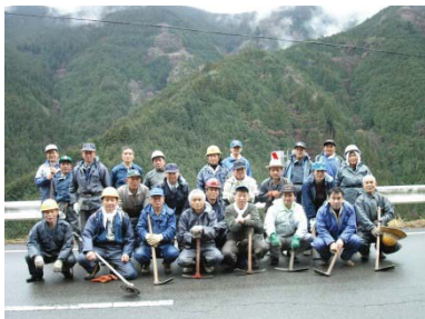
柳谷壮年会メンバー

柳谷 やなぎだに 壮年会が、平成15年から取り組んでいる事業で、5万本のさくらを地域内に植樹し、50年後に日本一のさくらの里とすることを目指しています。桜の苗木は、しっかり伸びるように種から育て、2年ほどで植樹できるようにしています。種蒔き、苗畑づくり、除草下刈りなどの作業は、90人の壮年会メンバーだけでなく地域の方々も積極的に参加し、一年一年桜色に染まる山が広がっており、地域ぐるみで「さくらの里づくり」を進めています。