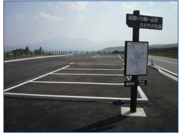
設置状況「簡易駐車場(ビューポイント)」