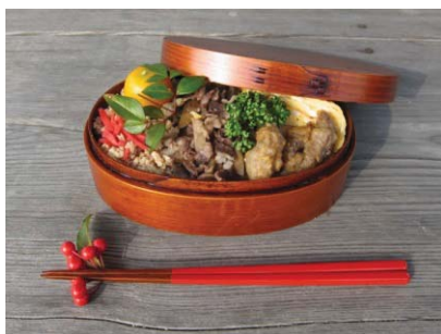
猪の天ぷらと山菜おこわ弁当