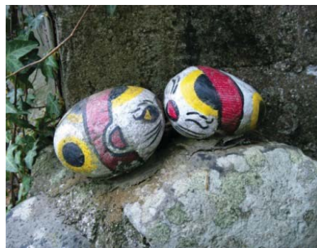
銀の道沿線に置かれた「福石猫」