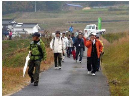
銀の道スーパーガイドの育成