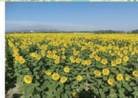
笠岡市【干拓地とひまわり】