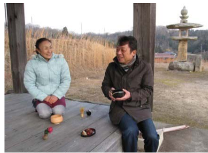
「辻堂」を活用した休憩・交流所