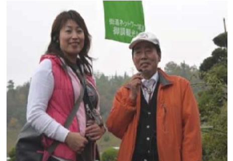
ワイヤレスヘッドセットを用いたご案内