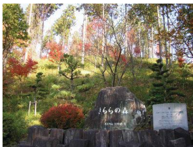
きららの森(森づくり)

道路からの眺望を良くするために道路沿いの立木(スギ、ヒノキ、雑木など)の一部伐採や、景観に配慮した森づくりを行っています。また、道路沿線の美化活動を定期的に行っており、訪れる人々が気持ちよく美しい自然資源を満喫できるよう景観を整備しています。