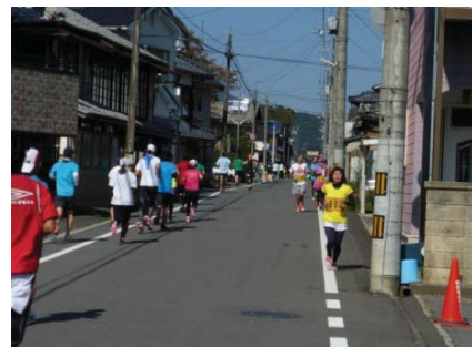
マラソン大会 レース状況