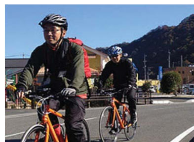
銀の道サイクリングイベント

サイクリングの聖地しまなみ海道を目指し、世界から大勢のサイクリストが訪れています。この賑わいを瀬戸内海から中国山地につなげていくために、銀の道沿線にサイクリストのための案内標識の整備やサイクリングイベントが広島・島根両県で検討されています。