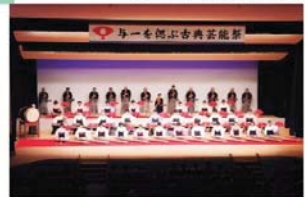
井原市【与一を偲ぶ古典芸能祭】