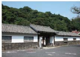
大田市【大森代官所跡】