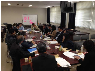
グループ討論の様子