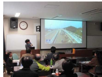
2日目の全体講義の様子