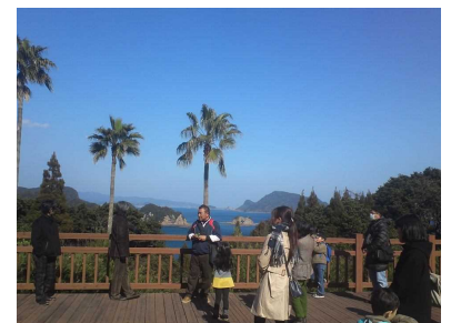
「道の駅」を巡るバスツアー