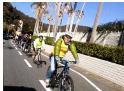
日南海岸きらめきラインを楽しむサイクリング

サイクリングでは、休むところにバイクラックがない、国道 220 号は路側が狭いという声も聞かれ、日南海岸線をサイクリングコースとして活用するための課題も見つかりました。