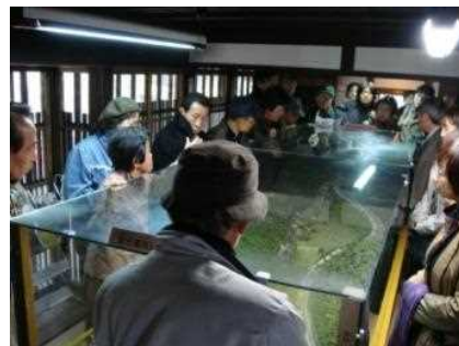
案内の様子。地域の概要説明では、「京都市嵯峨鳥居本町並み保存館」にあるジオラマを活用します。