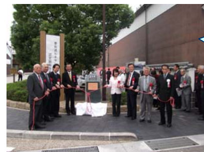
銘板除幕式の様子