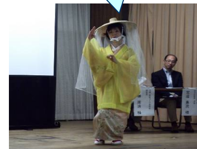
流しびな行列の踊り