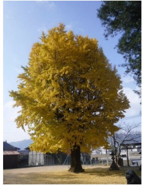
④ひちりき神社 境内の大イチョウは、この時期、黄色の絨毯に！