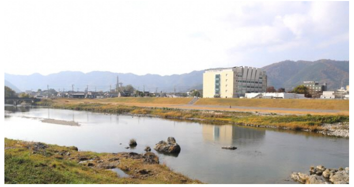
①せせらぎ公園 かつて高瀬舟の発着場があったところは親水公園として整備されている