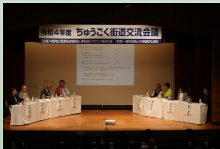
バラエティに富んだ活動報告