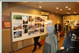
応募作品展示状況