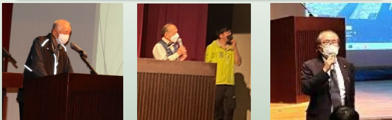
令和元年度認定地区の活動紹介