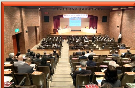
会議には各地区から約120人が参加

ディスカッションは、地域経済、定住、世代承継への貢献に関し、一つのきっかけとなっているのが「夢街道ルネサンス」や「日本風景街道」であることをお互いに認識し、このような活動を行っている活動団体から活動報告を受け、その後、会場を交えた意見交換を行うことにより、それぞれの団体が抱える課題の解決に向けたヒントや刺激を得るとともに、活動の更なる飛躍に向けて地区相互や関係行政機関等との連帯を深めていく場として行いました。